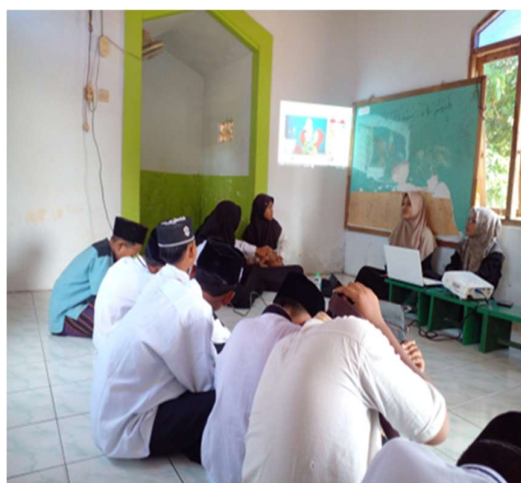
Gambar 2. Pembelajaran di TPQ Al-Ismail

Menurut Jannah (2021: 5) Perkembangan Taman Pendidikan Al-Qur'an tidak dapat dimiliki oleh setiap orang, dan tidak setiap orang dapat membangun dan memiliki Taman Pendidikan Al-Qur'an secara individu. Sejarah TPQ saat ini sudah dapat dipastikan waktu pembuatan kebijakannya dalam pelaksanaan pembinaan lembaga Pembina, namun beberapa tokoh agama berpendapat bahwa sebelum ada TPQ, sejak zaman nabi dan rasul sudah ada pelaksanaan kegiatan peningkatan dan kemampuan membaca, menulis, dan menghafal huruf Al-Qur'an. Pendapat para tokoh ini melihat dari bagaimana kegiatan manusia pada saat itu. Mempelajari dan menghafal Al-Qur'an adalah suatu kegiatan yang dilakukan dengan cara menghafal ayat demi ayat, baris, demi baris, surat-demi surat yang ada dalam Al-Qur'an dengan tujuan apabila membacanya akan bernilai ibadah dan menghafalkannya mendapatkan manfaat yang luar biasa.