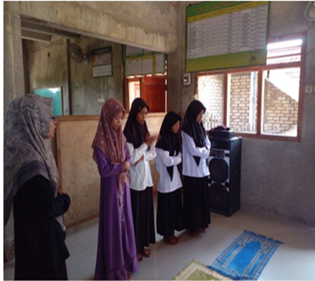
Gambar 3. Pelaksanaan Praktek Ibadah

Pada 24 Maret 2024, Mahasiswa/i IAINU Tuban menjalankan sebuah program kerja guna untuk memenuhi tugas akhir mata kuliah Pengembangan Masyarakat Islam. Program kerja tersebut kami laksanakan di TPQ Al-Ismail Desa Cokrowati, Kecamatan Tambakboyo dengan agenda "Pengembangan Masyarakat Islam: Peningkatan Daya Intelektual Santri Al-Ismail melalui Praktek Ibadah". Program tersebut dimulai dari santri memasuki kelas, dilanjut berdo'a dan membaca Asmaul Husna".