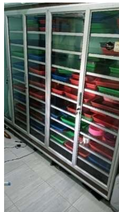
Gambar 3. Ruang/Kabinet Kedap Udara

Tahapan setelah perancangan ruang/kabinet adalah pembuatan ruang/kabinet sesuai desain dan spesifikasi yang telah ditentukan. Berikut ini merupakan hasil pembuatan ruang/kabinet. Ruang/kabinet kedap udara menurunkan kadar air pada madu yang sudah dipanen. Selain menurunkannya kadar air, ruang kedap udara juga mencegah kontaminasi madu dari organisme, hal ini tentunya akan berdampak pada meningkatnya umur simpan madu. Kadar air yang rendah juga menjaga konsistensi dan tekstur madu agar tidak terlalu encer. Untuk mencapai kadar air sesuai ambang batas yang ideal, diperlukan waktu penyimpanan kurang lebih 12 – 24 jam. Sebelum adanya ruang/kabinet kedap udara, penurunan kadar air membutuhkan waktu 5 – 7 hari. Penurunan waktu yang signifikan yang berdampak pada peningkatan produksi madu Trigona sp.