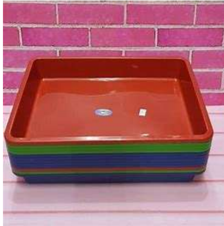
Gambar 4. Wadah Simpan Madu

Rak-rak plastik berfungsi sebagai wadah simpan madu di dalam ruang/kabinet. Waktu penurunan kadar air madu juga bergantung pada wadah yang digunakan. Faktor penting dalam wadah simpan madu adalah pendistribusian madu yang tipis sehingga meningkatkan distribusi permukaan madu yang terpapar udara. Untuk setiap luas penampang 1 \text{ cm}^2 dapat menurunkan kadar air sebesar 0,0083% (Sagaf et al. , 2022).