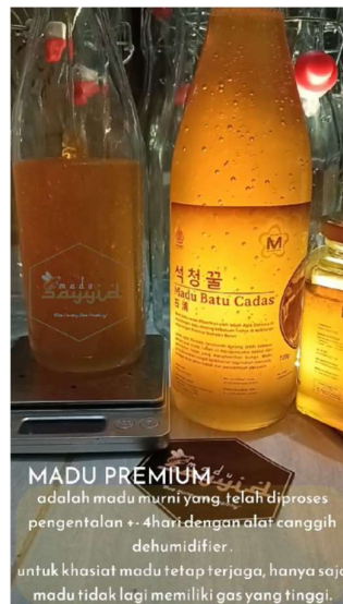
Gambar 5. Madu yang Telah Memenuhi SNI

Ruang/kabinet penurun kadar air yang telah diberikan kepada UMKM Sayyid madu telah memberikan dampak signifikan. Dampak tersebut antara lain turunnya kadar air madu dorsata yang telah memenuhi standar ekspor sekitar 17%-21%. Hal ini berdampak kepada meningkatnya permintaan madu dorsata. Salah satu permintaan madu yang tinggi disebabkan terjalannya kerja sama dengan sebuah perusahaan retail Korea di Jakarta. Kerjasama tersebut adalah permintaan tetap akan madu dorsata setiap periode tertentu tergantung permintaan di Jakarta. Berikut adalah gambaran madu murni dan madu yang telah memenuhi standar SNI dan ekspor.