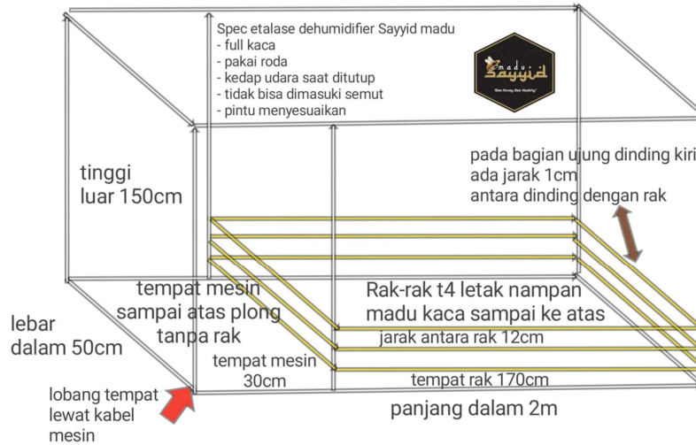
Gambar 2. Rancangan Ruang/Kabinet Kedap Udara

Ruang/kabinet yang dirancang terbuat dari kaca, dilengkapi dengan roda, dan bersifat kedap udara. Sifat kedap udara bertujuan untuk memudahkan proses penguapan air dan menghindari masuknya semut ke dalam cairan madu. Ruang/kabinet ini berukuran 1,5m x 2 m dan terdiri dari rak-rak plastik berukuran 3 x 10 x 5 cm yang disusun dengan jarak 12 cm.