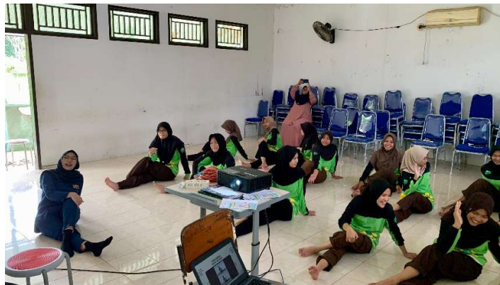
Gambar 3. Dokumentasi Penelitian

Setelah penyampaian materi dilakukan dengan panduan sesuai dengan leaflet lalu dilakukan posttest untuk mengukur peningkatan pemahaman partisipan terhadap materi yang telah di sampaikan. Terdapat peningkatan pemahaman yang signifikan mengenai definisi, penyebab dan tanda gejala dismenore serta manfaat dan dosis yoga dalam mengurangi dismenore.