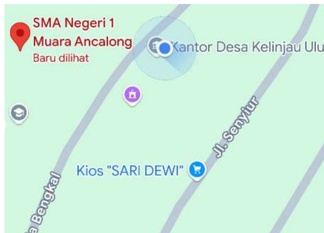
Gambar 2. Lokasi Penelitian

Program edukasi dismenore dan manfaat yoga dalam mengurangi dismenore pada anggota puteri saka bakti husada di laksanakan di SMA negeri 1 Muara Ancalong 1 Desa Kelinjau Ulu, Kecamatan Muara Ancalong, Kabupaten Kutai Timur, Kalimantan Timur, dengan kode pos 75556. Didasarkan pada keluhan anggota puteri saat menstruasi sering mengalami nyeri yang hilang timbul.