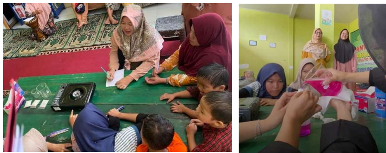
Gambar 3. Sesi Praktik Pelatihan Pembuatan Sabun Cair Sebagai Produk Wirausaha

Sesi kedua kegiatan ini yaitu sesi praktik, dimana peserta diajak secara langsung membuat sabun cair, yang dimulai dari proses pencampuran bahan, pengadukan, hingga pengemasan. Pada sesi ini dilakukan oleh tim dosen dibantu tiga orang mahasiswa Program Studi Kimia ITERA. Peserta dibagi ke dalam dua kelompok kecil, agar kegiatan praktik lebih kondusif.