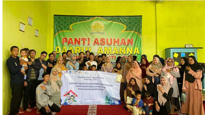
Gambar 3. Foto Bersama Peserta Kegiatan

secara rutin. Peningkatan kapasitas ini penting untuk memastikan bahwa pemahaman yang telah diperoleh tidak hanya berhenti pada pengetahuan, tetapi juga terinternalisasi menjadi perilaku sehari-hari. Dokumentasi peserta kegiatan dapat dilihat pada Gambar 3.