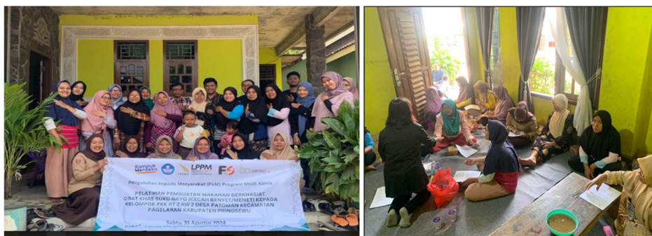
Gambar 4. Kegiatan mengisi kuesioner dan foto bersama

Makanan hasil pelatihan dicicipi secara bersama-sama oleh masyarakat dan memberikan tanggapan rasa yang masih diterima lidah dibandingkan dengan racikan ekstrak air obat dari kulit kayu aslinya. Setelah kegiatan pelatihan pembuatan makanan berkhasiat obat sakit perut, kegiatan terakhir PkM adalah pengisian Kuesioner pemahaman dan kepuasan Masyarakat terhadap kegiatan PkM serta foto bersama (Gambar 4).