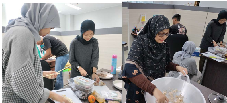
Gambar 1. Simulasi kegiatan pelatihan PkM

Simulasi kegiatan pelatihan pembuatan makanan obat sakit perut Cecah Benyet/Menet dilakukan sebelum kegiatan PkM yang bertujuan untuk mengantisipasi kondisi kelengkapan alat dan bahan serta mencegah kegagalan Gambar 1.