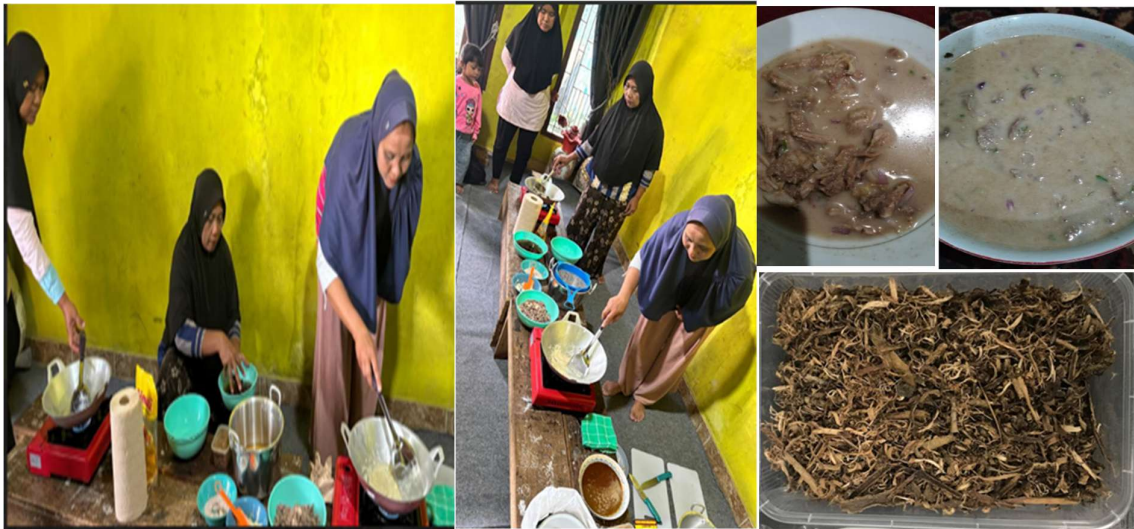
Gambar 3. Kegiatan Pelatihan PkM

Pelatihan yang diberikan pada Masyarakat yaitu membuat racikan ekstrak air beberapa kulit kayu dan mempersiapkan bahan lain seperti santan, bumbu giling dan daging rebus yang telah dicincang. Bumbu giling ditumis dengan sedikit minyak, setelahnya bumbu tumis diletakkan daging cincang. Daging cincang yang telah dibumbui di beri kuah santan dan ekstrak air kulit kayu serta digarami. Kegiatan Pelatihan dapat di lihat pada Gambar 3.