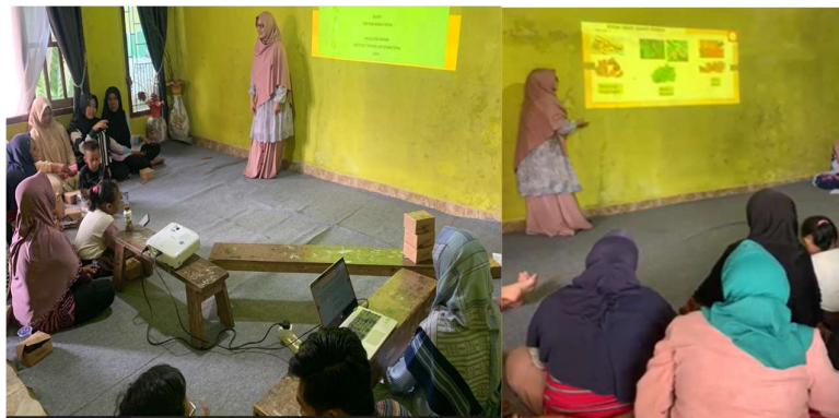
Gambar 2. Kegiatan sosialisasi PkM

Jenis TOGA yang terdiri dari rimpang-rimpangan, daun, dan kulit kayu memiliki potensi besar sebagai obat sakit perut. TOGA yang sangat familiar sebagai obat sakit perut adalah pohon jambu biji ( Psidium guajava ) yang dapat dimanfaatkan daun serta kulit batangnya. Daun dan kulit batang Jambu biji mengandung beberapa bahan aktif antara lain tanin, flavonoid, dan alkaloid yang memiliki efek farmakologi sebagai antidiare (Elyyana dkk, 2022). Selain itu, banyak lagi tumbuhan yang dapat berfungsi sebagai obat perut misalnya tumbuhan karamunting ( Rhodomyrtus tomentosa ) yang sering terlihat tumbuh di Semak belukar mengandung terpenoid, fenol dan tannin (Sinaga dkk, 2019). Ramuan kulit batang dari kedua jenis tumbuhan ini jika diracik akan menghasilkan rasa yang pahit dan sepat. Maka dari itu, PkM ini untuk memperkenalkan cara pengolahan tumbuhan obat sakit perut sebagai bumbu masakan daging dari daerah asal suku Gayo (Aceh) ke Masyarakat Lampung yaitu desa Patoman.