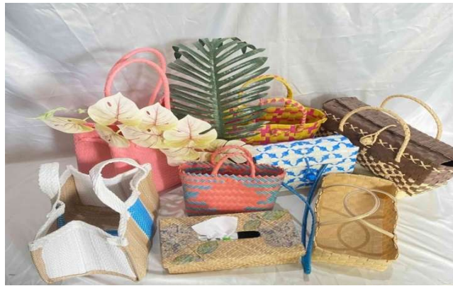
Gambar 1. Produk Tas Anyaman "My Keranjang"

Optimalisasi bisnis dilakukan melalui peningkatan efisiensi transaksi penjualan, pengelolaan data barang, dan peningkatan kualitas akun media sosial yang lebih menarik dan profesional, serta pembekalan keterampilan dalam pengelolaan platform digital dan kampanye pemasaran. Strategi digital diperkuat dengan pelatihan pembuatan dan pengelolaan konten untuk meningkatkan keterlibatan audiens, memperluas jangkauan, dan memperkuat citra merek. Pada aspek keuangan, pelatihan diarahkan pada penggunaan teknologi pencatatan dan pemahaman prinsip akuntansi agar pelaku UMKM mampu menyusun laporan secara mandiri dan akurat. Pelatihan UMKM diberikan melalui pembekalan strategi pemasaran, pemahaman bauran pemasaran (produk, harga, promosi, dan distribusi), serta pengelolaan akun e-commerce guna meningkatkan penjualan dan keterlibatan pelanggan secara daring. Sementara itu, inovasi produk difokuskan pada peningkatan desain, fungsionalitas, dan identitas merek untuk menarik minat konsumen dan memperkuat daya saing.