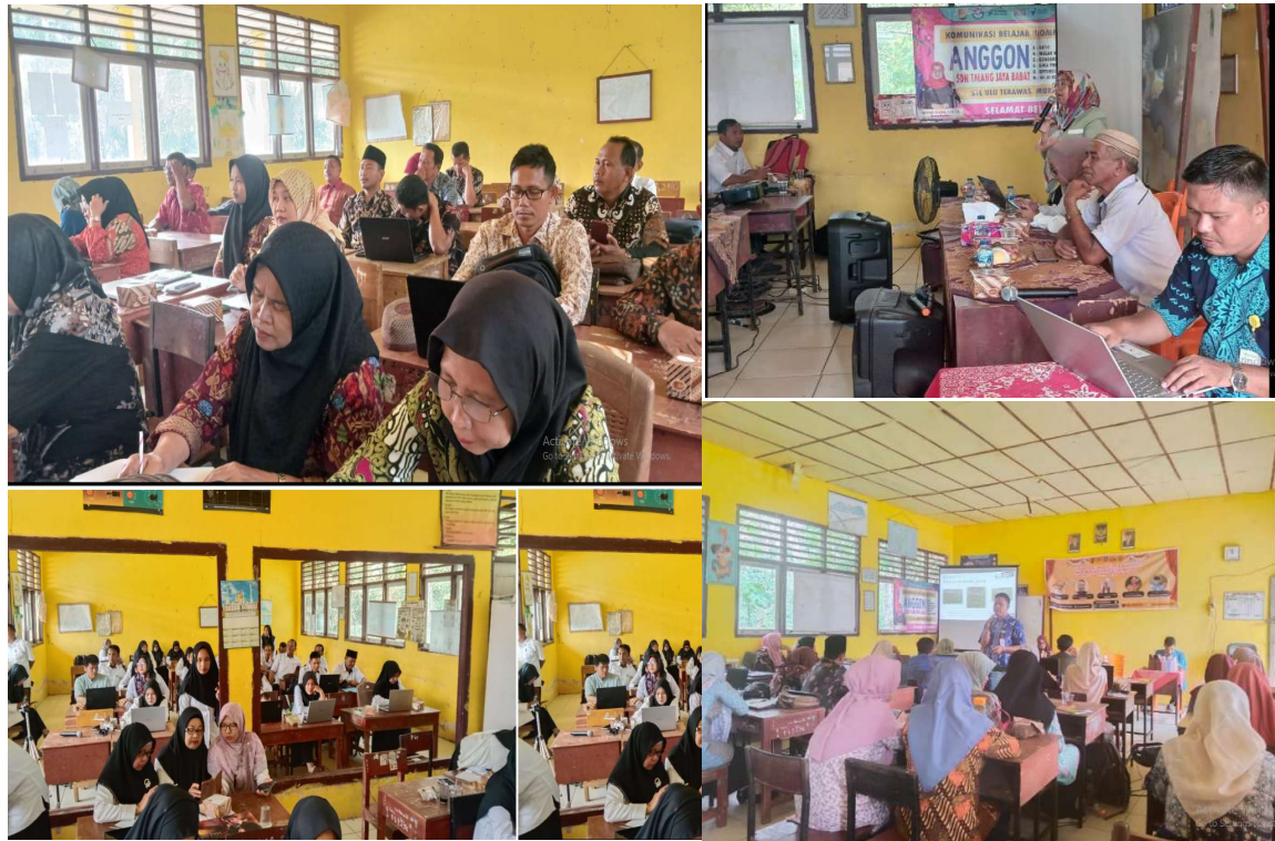
Gambar 3. Kegiatan Pelaksanaan PKM

Materi selanjutnya yaitu pembelajaran berdiferensiasi. Dalam materi ini, para guru belajar bagaimana mengadaptasi pembelajaran yang berbeda-beda untuk setiap siswa, sehingga pembelajaran dapat disesuaikan dengan kebutuhan dan kemampuan mereka. Selain itu, para guru juga belajar tentang berbagai teknik pembelajaran berdiferensiasi yang efektif dan dapat diaplikasikan di kelas. Kemudian dilanjutkan dengan kegiatan dimulai dengan materi Berbagi Praktik Baik Pembelajaran Berdiferensiasi. Para peserta diberikan kesempatan untuk berbagi pengalaman dan strategi dalam mengimplementasikan pembelajaran berdiferensiasi di kelas mereka. Pembelajaran berdiferensiasi adalah salah satu alternatif pembelajaran yang dapat digunakan untuk dapat memenuhi kebutuhan siswa di kelas.