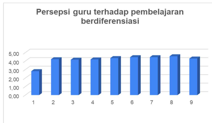
Gambar 4. Persepsi guru terhadap pembelajaran berdiferensiasi di SDN Terawas

Materi selanjutnya yaitu pembelajaran berdiferensiasi. Dalam materi ini, para guru belajar bagaimana mengadaptasi pembelajaran yang berbeda-beda untuk setiap siswa, sehingga pembelajaran dapat disesuaikan dengan kebutuhan dan kemampuan mereka. Selain itu, para guru juga belajar tentang berbagai teknik pembelajaran berdiferensiasi yang efektif dan dapat diaplikasikan di kelas. Kemudian dilanjutkan dengan kegiatan dimulai dengan materi Berbagi Praktik Baik Pembelajaran Berdiferensiasi. Para peserta diberikan kesempatan untuk berbagi pengalaman dan strategi dalam mengimplementasikan pembelajaran berdiferensiasi di kelas mereka. Pembelajaran berdiferensiasi adalah salah satu alternatif pembelajaran yang dapat digunakan untuk dapat memenuhi kebutuhan siswa di kelas.