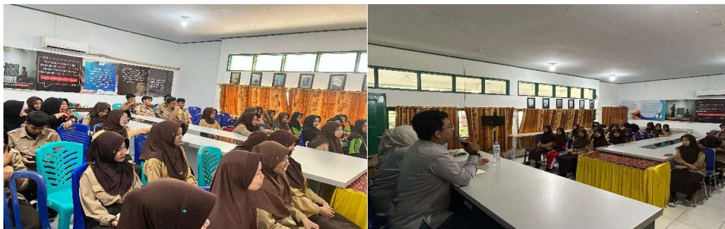
Gambar 3. Dokumentasi kegiatan sosialisasi