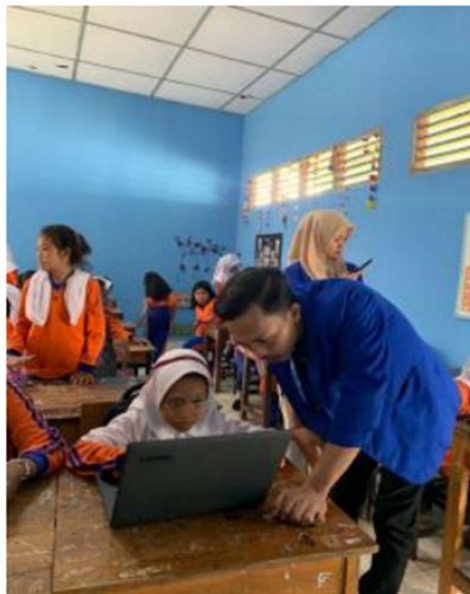
Gambar 4. Pelatihan Aplikasi Microsoft Word Pada Siswa – siswi SDN 28

Dari gambar 3 merupakan tampilan halaman kerja pada Microsoft Word. Pada aplikasi ini siswa – siswi SDN 28 diajarkan cara mengetik pada microsoft word. Kemudian diajarkan juga penggunaan tools – tools yang terdapat aplikasi microsoft word. Mengingat besarnya manfaat yang terdapat pada aplikasi word ini, maka tidak menutup kemungkinan aplikasi Microsoft word ini mau tidak mau harus dikuasai sejak dini oleh siswa – siswi SDN 28.