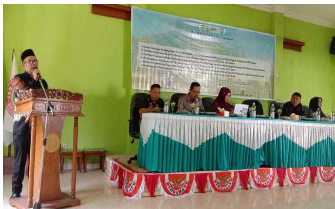
Gambar 1. Pembukaan Kegiatan Pengabdian

Selanjutnya, diberikan kuesioner kepada peserta untuk mendapatkan informasi tentang apa yang telah diketahui oleh peserta mengenai hal-hal yang berhubungan dengan pembelajaran berdiferensiasi dan penyusunan LKPD berdiferensiasi.