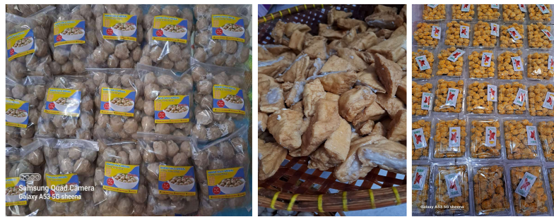
Gambar 1. Produk Bakso Pentol Shena

Standar Operasional Prosedur atau disingkat SOP adalah serangkaian instruksi tertulis mengenai bagaimana cara untuk melakukan pekerjaan, waktu pelaksanaan pekerjaan, tempat penyelenggaraan, dan siapa yang berperan dalam pekerjaan tersebut (Sakti et al., 2020). SOP ini mempunyai tujuan dalam komitmen pekerjaan sehingga terwujud good governance dan sebagai fungsi untuk menilai kerja baik secara internal maupun eksternal (Taufiq, 2019). UMKM Bakso Pentol Shena merupakan UMKM yang memproduksi bakso yang berlokasi di Desa Waluya, Cikarang Utara, Kabupaten Bekasi. Owner dari UMKM ini adalah Ibu Verania Hikma, yang memulai usaha ini pada tahun 2016. Saat ini, permintaan dari tahun ke tahun terus melonjak. Tanggapan konsumen mengenai bakso ini adalah enak. UMKM ini memproduksi bakso yang dipackaging untuk dijual kepada konsumen. Berikut adalah foto produk Bakso Pentol Shena: