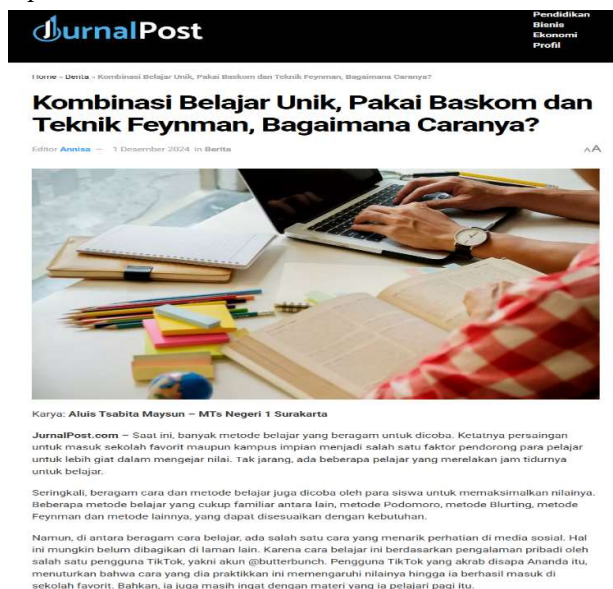
Gambar 4. Hasil Tulisan Siswa MTs 1 Surakarta

Setelah melalui proses penyuntingan oleh tim pengabdian, salah satu artikel yang dihasilkan oleh siswa dipublikasikan ke dalam salah satu portal berita online , yaitu Jurnal Post. Ini dilakukan untuk memberikan pengalaman menulis serta meningkatkan kepercayaan diri siswa dalam mengekspresikan ide dan kreativitas mereka. Ditargetkan sebanyak 8 artikel untuk dipublikasikan, akan tetapi hanya satu artikel yang dapat dipublikasikan dikarenakan adanya jadwal kegiatan ekstrakurikuler lainnya yang dilakukan oleh beberapa peserta.