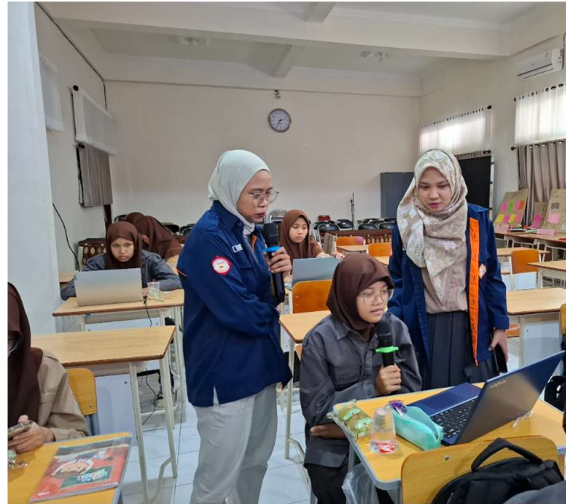
Gambar 3. Proses Penyuntingan Tulisan Artikel Siswa

mengirimkan kembali hasil suntingan mereka kepada tim pengabdian untuk dipublikasikan ke salah satu media rekanan tim pengabdian. Dalam proses penyuntingan, tim pengabdian berfokus pada perbaikan kesalahan penulisan berita seperti nilai berita, komposisi berita, tata bahasa, dan juga penggunaan ejaan yang disempurnakan.