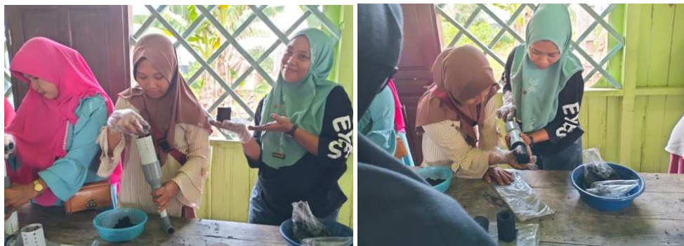
Gambar 3. Sesi Praktik Pembuatan Briket Arang

Berdasarkan evaluasi kegiatan dari pelatihan ini, beberapa peserta mampu mengulangi proses pembuatan briket secara mandiri setelah pendampingan oleh tim. Hal ini menunjukkan bahwa tujuan pertama kegiatan, yaitu membekali peserta dengan kemampuan praktis dalam proses pembuatan briket telah tercapai. Selain aspek teknis, kegiatan ini juga memicu kesadaran baru pada masyarakat tentang pentingnya pengolahan limbah pertanian. Selama diskusi, banyak peserta menyatakan bahwa sebelumnya sekam padi hanya dibakar atau dibuang tanpa dimanfaatkan. Kini, mereka menyadari bahwa limbah tersebut memiliki nilai guna yang tinggi apabila diolah secara tepat. Selanjutnya, pemanfaatan briket sebagai sumber energi alternatif turut membuka peluang bagi masyarakat untuk mengurangi ketergantungan terhadap bahan bakar fosil seperti LPG. Uji coba pembakaran briket menunjukkan bahwa briket sekam padi memiliki daya bakar yang cukup stabil. Meskipun efisiensinya masih perlu ditingkatkan untuk pengembangan lebih lanjut. Dari sisi lingkungan, pelatihan ini juga mendorong perubahan pola pikir masyarakat mengenai pentingnya produksi ramah lingkungan. Diskusi penutup pelatihan menunjukkan bahwa masyarakat mulai mempertimbangkan pemanfaatan limbah lain seperti serbuk gergaji atau dedak, sebagai bahan baku alternatif untuk produk serupa.