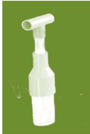
Gambar 2. Alat Press Briket Sederhana