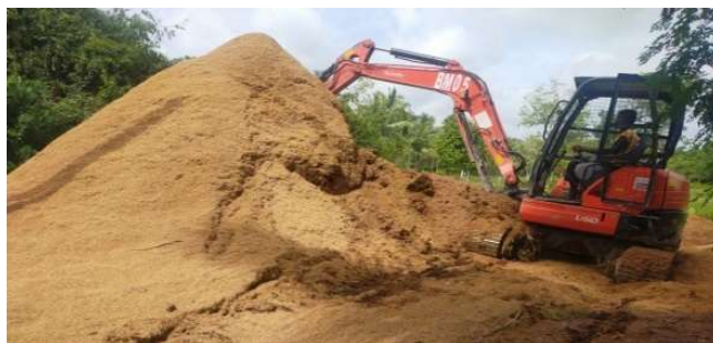
Gambar 1. Perataan Limbah Sekam Menggunakan Eskafator

Berdasarkan analisis situasi yang telah dilakukan, permasalahan yang dialami oleh masyarakat Desa Sajau Hilir salah satunya pengelolaan limbah yang kurang efektif. Berdasarkan data statistik, panen padi kering dalam setahun sebanyak 2 kali panen. Tiap panen seluas 300 hektar dan menghasilkan 5 sampai 6 ton per hektar. Jika dikalkulasikan diperoleh hasil panen padi 3.600 ton dalam setahun. Sehingga sekam padi yang dihasilkan tiap panen \pm 720 ton dalam setahun. Limbah ini seringkali dibuang begitu saja, diratakan menggunakan eskafator atau dibakar yang tentunya menyebabkan polusi udara dan pencemaran lingkungan.