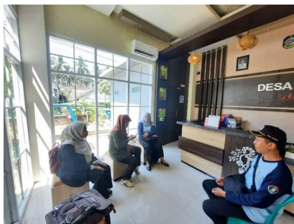
Gambar 1. Diskusi bersama Perangkat Desa Tambong