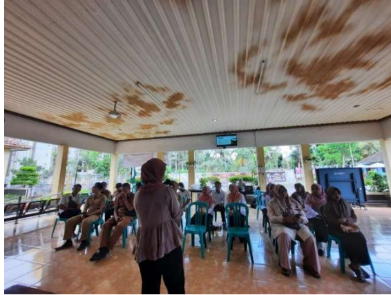
Gambar 2. Sesi Pemaparan Materi