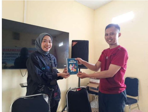
Gambar 4. Penyerahan Buku Panduan