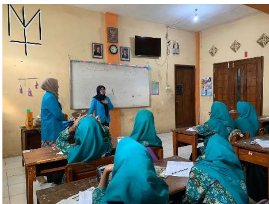
Gambar 1. Pemaparan Materi Cerita Pendek

terutama dalam pengembangan konflik dan penyelesaian cerita. Meski demikian, semua siswa menunjukkan kemajuan yang berarti dibandingkan dengan kemampuan awal mereka.