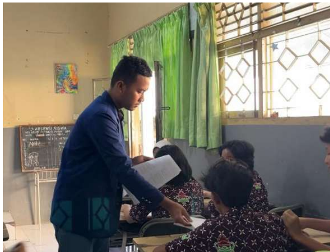
Gambar 1. Pembagian soal pre-test

Kegiatan pengabdian masyarakat yang dilaksanakan di SMP Negeri 1 Wates, pada tanggal 16 Mei 2025 terhadap 32 siswa kelas VIII F menghasilkan temuan yang signifikan mengenai profil manajemen waktu siswa. Berdasarkan hasil pre-test yang dilakukan sebelum intervensi, terungkap bahwa meskipun sebagian besar responden telah mengenal konsep dasar manajemen waktu secara teoritis, hanya 1 siswa (3%) yang benar-benar mampu menerapkan prinsip-prinsip tersebut dalam aktivitas sehari-harinya secara konsisten. Fenomena ini menunjukkan adanya kesenjangan yang cukup besar antara pemahaman konseptual dan kapasitas aplikatif, suatu temuan yang sejalan dengan penelitian Eudya dkk. (2021) tentang implementasi manajemen waktu di kalangan pelajar SMP.