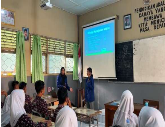
Gambar 2. Pemaparan materi oleh anggota kelompok