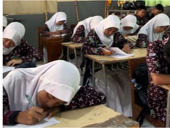
Gambar 3. Pengerjaan soal post-test

Hasil post-test menunjukkan peningkatan yang menggembirakan dalam beberapa aspek kunci. Kemampuan siswa dalam memahami materi meningkat sebanyak 81%. Kemudian, sebanyak 84% responden memahami manfaat to-do list yang efek digunakan dalam manajemen waktu. Sebanyak 59% responden mulai mengerti untuk mengerjakan tugas yang bersifat mendesak terlebih dahulu, kemudian beralih ke tugas yang lebih sulit, dan terakhir mengerjakan tugas yang relatif lebih mudah. Namun, pada pertanyaan aplikatif tentang penerapan manajemen waktu untuk menghadapi ujian, hanya 16 siswa (50%) yang mampu memberikan contoh konkret. Temuan ini mengindikasikan bahwa pendekatan pembelajaran yang digunakan telah berhasil membangun pemahaman dasar yang kuat, namun perlu diperkuat dengan lebih banyak latihan aplikatif dan studi kasus konkret untuk meningkatkan kemampuan penerapan dalam berbagai situasi. Seperti pentingnya menciptakan lingkungan belajar yang mendukung melalui kolaborasi antara guru, orang tua, dan siswa sendiri.