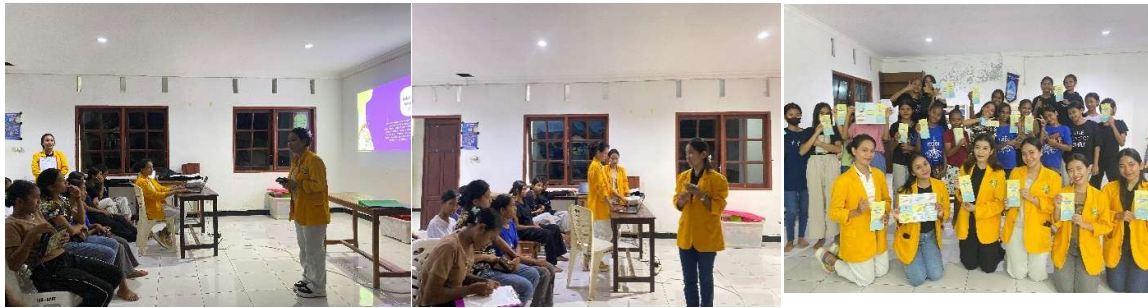
Gambar 2. Pelaksanaan Kegiatan

Berdasarkan hasil analisis yang telah dilakukan menunjukkan bahwa penyuluhan kesehatan reproduksi pada remaja putri di PPA GMT Bet'el Oesapa efektif dan mencapai tujuan yang diharapkan.