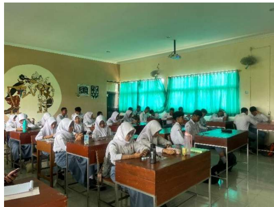
Gambar 3. Refleksi diri