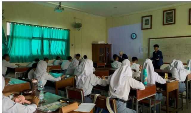
Gambar 2. Pemaparan materi growth mindset

Sebelum memulai kegiatan pemaparan materi mengenai growth mindset, tim pelaksana melakukan interaksi awal dengan para siswa peserta kegiatan melalui pengajuan pertanyaan-pertanyaan sederhana guna mengetahui sejauh mana pemahaman awal mereka terkait konsep tersebut. Respon dari mayoritas siswa menunjukkan bahwa mereka belum memiliki pengetahuan yang mendalam mengenai growth mindset. Temuan ini mengonfirmasi bahwa terdapat kesenjangan pemahaman di kalangan siswa terkait pola pikir berkembang, sehingga pentingnya pelaksanaan kegiatan pengabdian ini menjadi semakin relevan, khususnya dalam konteks penguatan karakter dan kesiapan mental siswa Generasi Z.