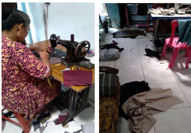
Gambar 1. Kondisi awal mitra