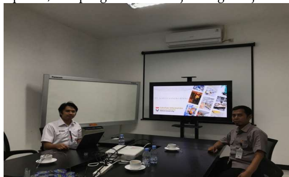
Gambar 2. Sosialisasi dan pemasangan alat

Proses autentikasi dimulai saat pengguna memindai sidik jarinya pada perangkat fingerprint reader. Terlihat pada Gambar 1 proses autentikasi user diproses dari data biometric user pengguna mesin. Data biometrik yang dihasilkan dari pemindaian ini kemudian dikirimkan ke server melalui jalur komunikasi yang aman, menggunakan enkripsi AES untuk mencegah pencurian data saat proses pengiriman. Setibanya di server, sistem melakukan verifikasi dengan cara mencocokkan data sidik jari yang diterima dengan data pegawai yang sudah tersimpan sebelumnya di sistem manajemen perusahaan. Jika data cocok, maka pegawai tersebut diberi akses untuk mengoperasikan mesin produksi. Jika tidak, sistem akan menolak akses secara otomatis. Selain mengatur akses, sistem ini juga mencatat seluruh aktivitas yang terjadi setelah autentikasi berhasil. Informasi yang disimpan dalam database mencakup nama pegawai yang menggunakan mesin, waktu penggunaan (mulai dan selesai), serta durasi penggunaan. Pencatatan ini berguna untuk berbagai keperluan seperti audit internal, evaluasi kepatuhan terhadap SOP, dan pengelolaan kinerja tenaga kerja serta efisiensi mesin produksi.