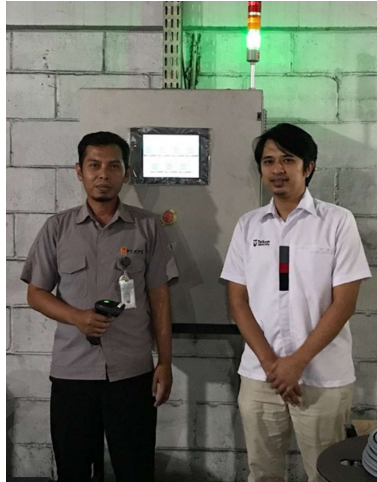
Gambar 3. Server IoT Lokasi diproduksi

Dengan sistem ini, proses pengoperasian mesin menjadi lebih aman, terpantau, dan terdokumentasi dengan baik, serta dapat mendukung langkah awal PT. KPS dalam mengadopsi sistem industri berbasis digital. Pada gambar 2 telah dilakuakn sosialisasi dan pelatihan untuk alat autentikasi mesin.