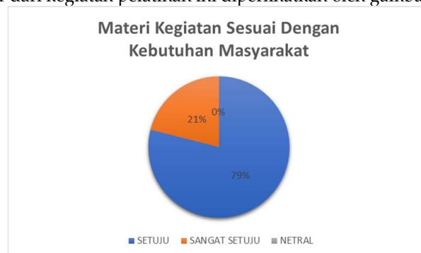
Gambar 3. Analisis Hasil Kuesioner

Keberhasilan kegiatan dievaluasi melalui pembagian kuesioner kepada peserta pelatihan. Kuesioner ini berisi sejumlah pernyataan yang menilai kesesuaian materi dengan kebutuhan masyarakat, kecukupan durasi kegiatan, kejelasan penyampaian materi, kualitas pelayanan panitia, serta tanggapan peserta terhadap kegiatan dan harapan agar program serupa dapat berlanjut di masa depan. Pertanyaan dalam kuesioner disusun secara jelas dan terstruktur, sehingga memudahkan peserta untuk mengisi secara mandiri tanpa memerlukan pendampingan. Pendekatan ini juga meminimalkan keterlibatan peneliti dalam proses pengisian, yang pada akhirnya dapat mengurangi potensi bias dalam hasil evaluasi (Siti Romdona et al., 2025). Hasil evaluasi ini memberikan gambaran menyeluruh mengenai efektivitas program dan menjadi dasar penting dalam melakukan perbaikan maupun perencanaan kegiatan selanjutnya agar lebih tepat sasaran, relevan dengan kebutuhan, dan berkualitas. Pengukuran keberhasilan kegiatan dilakukan melalui penyebaran kuesioner kepada peserta pada akhir sesi pelatihan. Kuesioner ini diisi oleh 19 orang peserta yang merupakan kelompok usaha Mutiara Tani dari Desa Bojongsoang yang juga dan pengelola ternak bebek di wilayah tersebut. Analisis hasil kuesioner dari kegiatan pelatihan ini diperlihatkan oleh gambar 3.