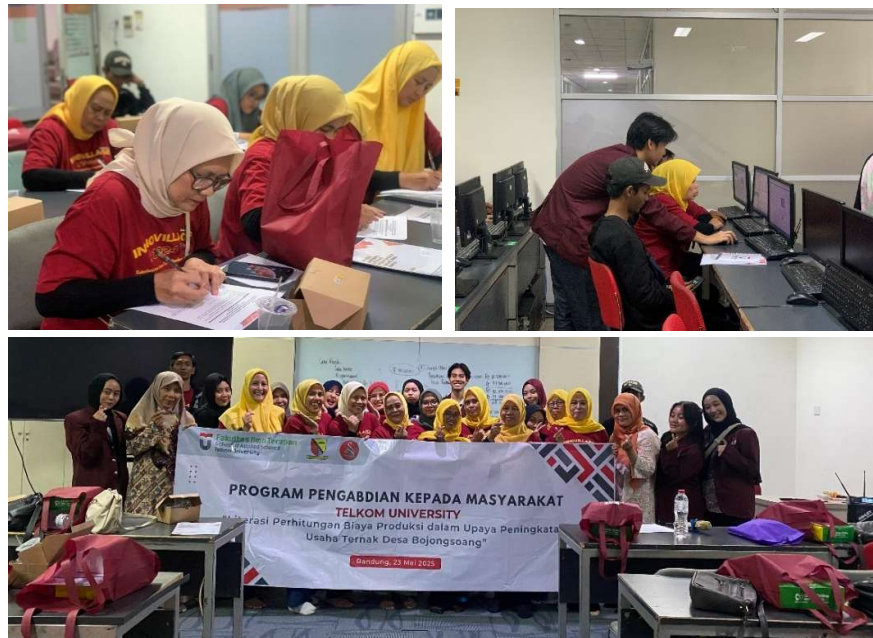
Gambar 2. Foto Kegiatan Pelatihan

Keberhasilan kegiatan dievaluasi melalui pembagian kuesioner kepada peserta pelatihan. Kuesioner ini berisi sejumlah pernyataan yang menilai kesesuaian materi dengan kebutuhan masyarakat, kecukupan durasi kegiatan, kejelasan penyampaian materi, kualitas pelayanan panitia, serta tanggapan peserta terhadap kegiatan dan harapan agar program serupa dapat berlanjut di masa depan. Pertanyaan dalam kuesioner disusun secara jelas dan terstruktur, sehingga memudahkan peserta untuk mengisi secara mandiri tanpa memerlukan pendampingan. Pendekatan ini juga meminimalkan keterlibatan peneliti dalam proses pengisian, yang pada akhirnya dapat mengurangi potensi bias dalam hasil evaluasi (Siti Romdona et al., 2025). Hasil evaluasi ini memberikan gambaran menyeluruh mengenai efektivitas program dan menjadi dasar penting dalam melakukan perbaikan maupun perencanaan kegiatan selanjutnya agar lebih tepat sasaran, relevan dengan kebutuhan, dan berkualitas. Pengukuran keberhasilan kegiatan dilakukan melalui penyebaran kuesioner kepada peserta pada akhir sesi pelatihan. Kuesioner ini diisi oleh 19 orang peserta yang merupakan kelompok usaha Mutiara Tani dari Desa Bojongsoang yang juga dan pengelola ternak bebek di wilayah tersebut. Analisis hasil kuesioner dari kegiatan pelatihan ini diperlihatkan oleh gambar 3.