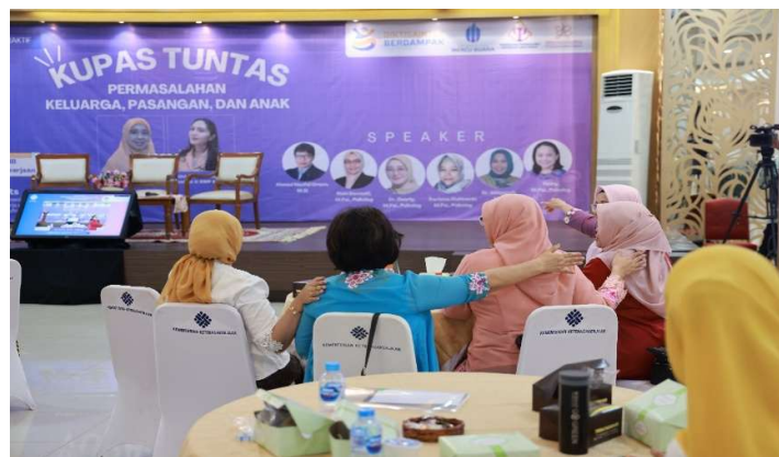
Gambar 3. Peserta sedang melakukan icebreaking

Selanjutnya, pelatihan literasi juga perlu dilengkapi dengan strategi komunikasi dan pendekatan pengasuhan digital yang suportif. Orang tua diajarkan cara berdialog terbuka tanpa menghakimi, menerapkan digital co-use (menggunakan media bersama anak), dan menjadi digital role model. Metode ini telah terbukti lebih efektif dalam membentuk perilaku sehat bermedia dibandingkan pendekatan otoriter atau melarang total (Wartella, E., Rideout, V., Lauricella, A. R., & Connell, 2020). Dengan memiliki keterampilan tersebut, orang tua dapat menciptakan suasana saling percaya dan mendampingi anak menjelajahi dunia digital dengan aman dan bijak.