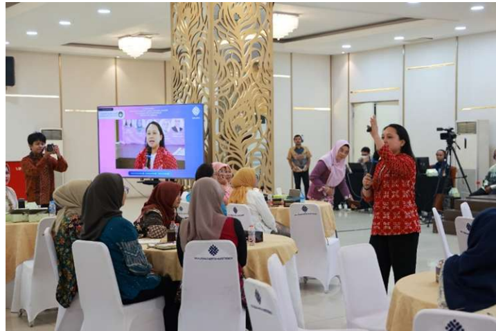
Gambar 4. Pemateri literasi

Rangkaian kegiatan diakhiri dengan dilakukan evaluasi terhadap pelaksanaan kegiatan, evaluasi dilakukan dengan memberikan kuesioner evaluasi, dengan hasil sebagai berikut