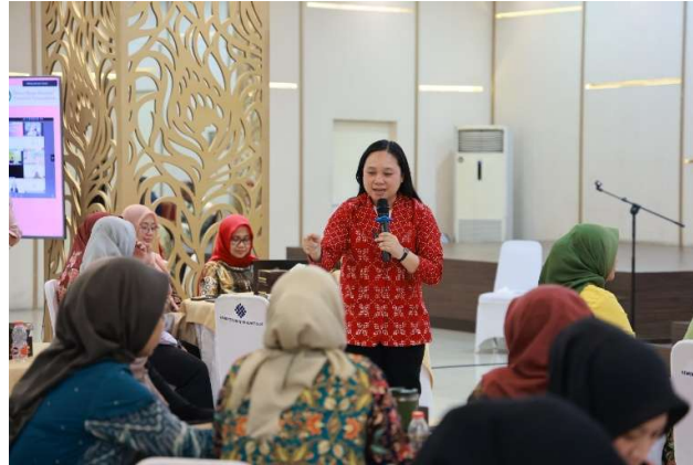
Gambar 2. Pemateri Literasi Media

Orang tua juga diberikan pemahaman terkait dampak psikologis media sosial. Orang tua perlu diberi wawasan tentang bagaimana penggunaan berlebihan dapat memengaruhi kesehatan mental, harga diri, dan hubungan sosial anak. Penelitian dari (Borge, 2022) menunjukkan adanya korelasi antara waktu layar yang tinggi dan peningkatan risiko depresi pada remaja.