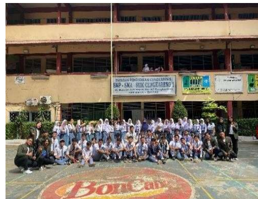
Gambar 3. Foto Bersama Peserta