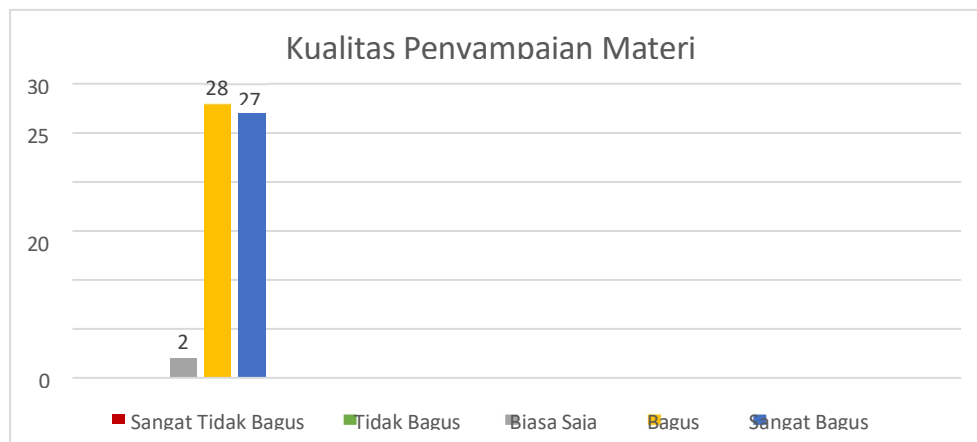
Gambar 5. Hasil Survei Kualitas Penyampaian Materi

Berdasarkan gambar 7.2 dapat diketahui bahwa 28 responden merasa kualitas materi yang disampaikan bagus, 27 responden merasa materi yang disampaikan sangat bagus, dan 2 responden merasa materi yang disampaikan biasa saja. Dengan demikian, dapat disimpulkan bahwa sebagian besar responden merasa kualitas penyampaian materi MBTI bagus.