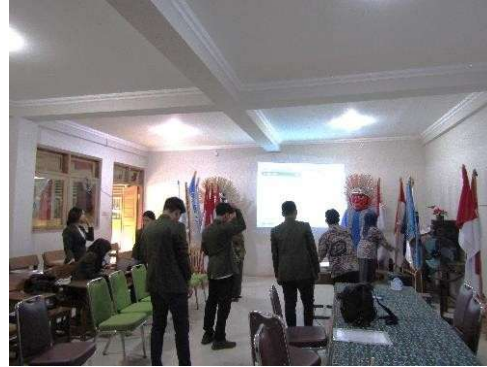
Gambar 1. Persiapan Sebelum Kegiatan