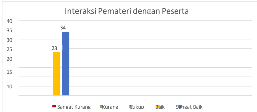
Gambar 7. Hasil Survei Interaksi Pemateri dengan Peserta

Berdasarkan gambar 7 dapat diketahui bahwa 34 responden merasa interaksi antara pemateri dengan peserta sangat baik, dan 23 responden merasa interaksi antara pemateri dengan peserta baik. Dengan demikian, dapat disimpulkan bahwa mayoritas peserta workshop merasa sangat puas dengan interaksi pemateri.