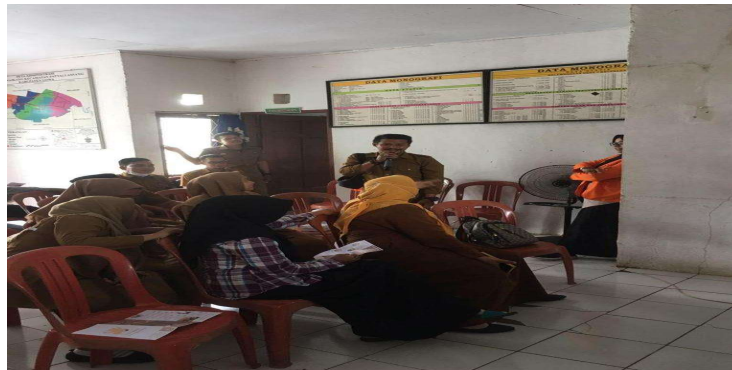
Gambar 3. Sesi tanya jawab saat penyuluhan

Secara umum masyarakat ternyata belum bisa memanfaatkan tanaman obat selain karena kurang memahami manfaatnya juga karena cara pengolahannya. Melalui penyuluhan ini masyarakat diharapkan bisa memanfaatkan pekarangan rumah dengan menanam tanaman obat. Olehnya itu masyarakat juga dibagikan tanaman obat sebagai contoh yang nantinya ditanam dipekaranga rumah masing-masing. Sebagai bentuk tindak lanjut kegiatan ini dilakukan evaluasi dengan mengobservasi pekarangan rumah masyarakat yang sudah dibagikan tanaman obat