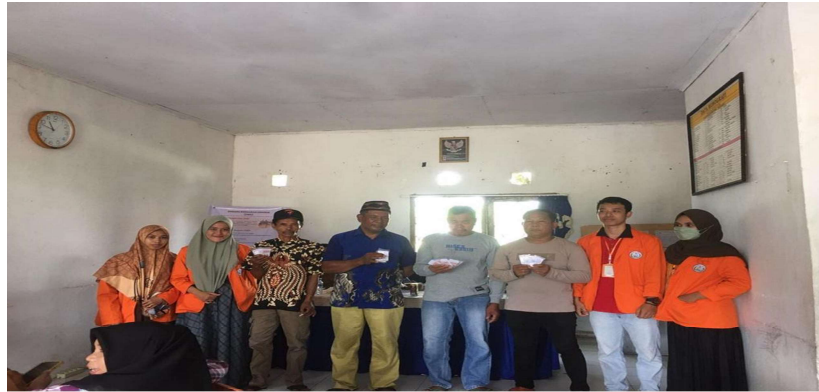
Gambar 4. Foto Bersama peserta penyuluhan