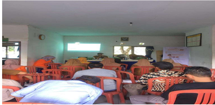
Gambar 2. Pelaksanaan Penyuluhan

Pelaksanaan kegiatan PKM yang dilakukan dalam penyuluhan manfaat tanaman obat keluarga di Desa Jennetallasa. Materi edukasi disampaikan langsung kepada kader puskesmas bersama masyarakat terkait manfaat TOGA dan memberikan simulasi cara pengolahan tanaman obat. Masyarakat sangat mengapresiasi kegiatan ini melalui umpan balik berupa pertanyaan yang selanjutnya di jawab sehingga masyarakat dengan mudah memahami tanaman obat keluarga selain dapat digunakan oleh anggota keluarga juga bisa mengurangi pengeluaran keluarga.