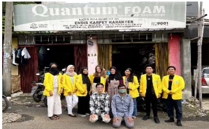
Gambar 2. Wawancara dengan Endis Production

Proses akuntansi pada zaman sekarang harus dilakukan secara komputerisasi (Fauzi dkk., 2023), kami menemukan sebuah solusi yaitu dengan membuat “Aplikasi keuangan berbasis web” yang mudah untuk digunakan karena sangat user-friendly , seperti bisa untuk mencatat daftar transaksi uang keluar atau masuk, daftar utang-piutang yang cocok digunakan karena Endis Production banyak pelanggan dan pemasok dari luar daerah, lalu juga bisa menginput akun-akun rekening yang menampung uang keluar atau masuk, dan yang terakhir pastinya laporan uang keluar atau masuk yang dapat digunakan sebagai alat pertimbangan untuk pengambilan keputusan.