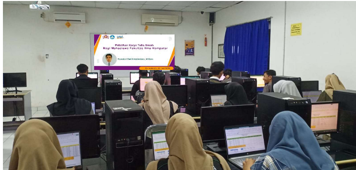
Gambar 3. Praktik Peserta Karya Ilmiah

Peserta sangat antusias dalam mengikuti kegiatan pelatihan yang dilaksanakan menurut peserta mereka sangat terbantu dalam memahami bagaimana membuat artikel ilmiah dengan mudah dan cepat, yang sebelumnya para peserta hanya mampu memahami secara teori namun saat praktik membuat artikel ilmiah merasa kesulitan. Dari kegiatan ini panitia dan pembicara memberikan apresiasi terhadap peserta dengan memberikan hadiah pada peserta yang mampu membuat artikel ilmiah dan disubmit ke redaksi jurnal ilmiah.