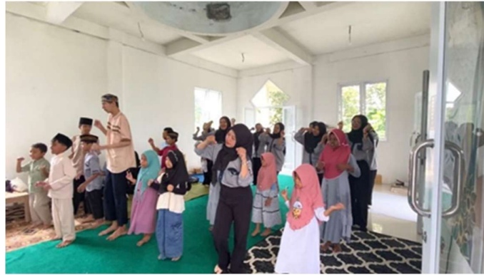
Gambar 4. Kegiatan Menari Bersama

mempererat hubungan antara mahasiswa dan anak-anak panti dalam suasana yang penuh kegembiraan.