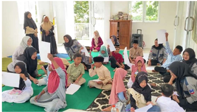
Gambar 2. Lomba Cerdas Cermat

Setelah cerdas cermat, anak panti diajak melakukan perlombaan estafet mewarnai untuk menumbuhkan nilai gotong royong, kreativitas, dan kebersamaan pada anak-anak. Kegiatan ini didesain tidak hanya sebagai aktivitas seni, tetapi juga sebagai sarana membangun kerja sama tim dalam menyelesaikan satu tugas secara bergiliran dan saling melengkapi. Sebelum kegiatan dimulai, anak-anak terlebih dahulu diajak mengikuti permainan sekoci yang berfungsi sebagai pemanasan dan sarana membentuk kelompok. Permainan ini membuat suasana menjadi lebih akrab dan ceria, sekaligus memecah kekakuan antar peserta. Setelah kelompok terbentuk, setiap tim diberikan satu lembar gambar besar bertema gotong royong dan alat mewarnai yang telah disediakan oleh panitia. Setiap anak diberikan waktu 30 detik untuk mewarnai bagian tertentu, kemudian digantikan oleh anggota berikutnya dalam kelompok. Sistem ini mengajarkan anak-anak untuk menghargai waktu, saling melanjutkan pekerjaan teman, dan menjaga kekompakan tim agar hasil akhir tetap harmonis.