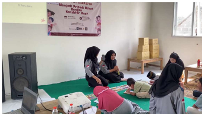
Gambar 3. Lomba Estafet Mewarnai

Setelah cerdas cermat, anak panti diajak melakukan perlombaan estafet mewarnai untuk menumbuhkan nilai gotong royong, kreativitas, dan kebersamaan pada anak-anak. Kegiatan ini didesain tidak hanya sebagai aktivitas seni, tetapi juga sebagai sarana membangun kerja sama tim dalam menyelesaikan satu tugas secara bergiliran dan saling melengkapi. Sebelum kegiatan dimulai, anak-anak terlebih dahulu diajak mengikuti permainan sekoci yang berfungsi sebagai pemanasan dan sarana membentuk kelompok. Permainan ini membuat suasana menjadi lebih akrab dan ceria, sekaligus memecah kekakuan antar peserta. Setelah kelompok terbentuk, setiap tim diberikan satu lembar gambar besar bertema gotong royong dan alat mewarnai yang telah disediakan oleh panitia. Setiap anak diberikan waktu 30 detik untuk mewarnai bagian tertentu, kemudian digantikan oleh anggota berikutnya dalam kelompok. Sistem ini mengajarkan anak-anak untuk menghargai waktu, saling melanjutkan pekerjaan teman, dan menjaga kekompakan tim agar hasil akhir tetap harmonis.