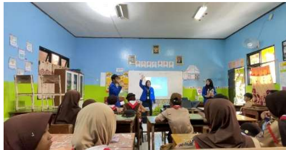
Gambar 4. Pemberian Edukasi Kepada Anak Kelas VI