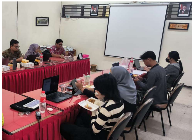
Gambar 5. Dokumentasi penyusunan Modul Kelembagaan Pokdarwis

Berdasarkan hasil identifikasi kebutuhan pada tahap awal, tim pengabdian menyusun modul pelatihan kelembagaan Pokdarwis yang dirancang secara kontekstual dan aplikatif. Modul ini terdiri atas empat pokok materi utama: (1) dasar-dasar kelembagaan dan urgensinya dalam pengelolaan desa wisata; (2) struktur organisasi Pokdarwis dan pembagian peran yang efektif; (3) perencanaan program kerja berbasis potensi lokal; dan (4) strategi promosi dan kemitraan kelembagaan.