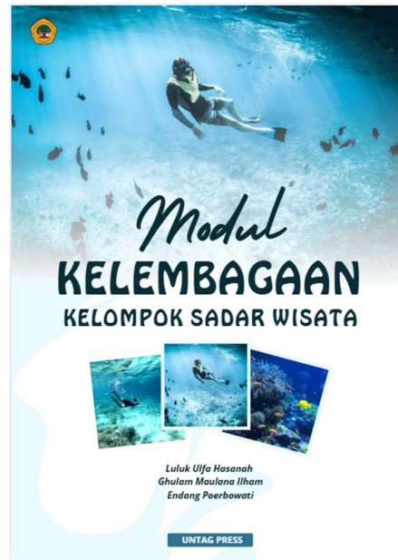
Gambar 6. Sampul Modul Kelembagaan Kelompok Sadar Wisata