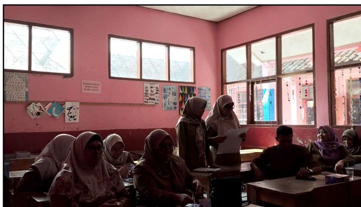
Gambar 5. Presentasi Kelompok Garuda

Kelompok kedua, yaitu kelompok garuda memilih untuk mendiskusikan lagu hari merdeka. Berdasarkan diskusi kelompok garuda, didapatkan kesimpulan makna lagu secara denotasi dan konotasi dan rencana penerapan bagi siswa. Makna denotasi lagu Hari Merdeka adalah menyampaikan peristiwa kemerdekaan Indonesia yang diproklamasikan pada tanggal 17 Agustus 1945. Lirik lagu menggambarkan momen kebebasan bangsa Indonesia dari penjajahan, serta menyebut langsung tanggal lahirnya negara yang merdeka. sedangkan makna konotasi adalah lagu ini mengandung makna semangat perjuangan, rasa syukur atas kemerdekaan, cinta tanah air, dan tekad untuk mempertahankan kemerdekaan. Lagu ini mengajarkan tentang semangat juang dan rasa syukur atas kemerdekaan. Guru dapat menggunakannya untuk menanamkan nasionalisme, tanggung jawab, dan disiplin dalam kehidupan sehari-hari bagi siswa. Adapun kelompok garuda menuliskan bentuk rencana kegiatan, yaitu: