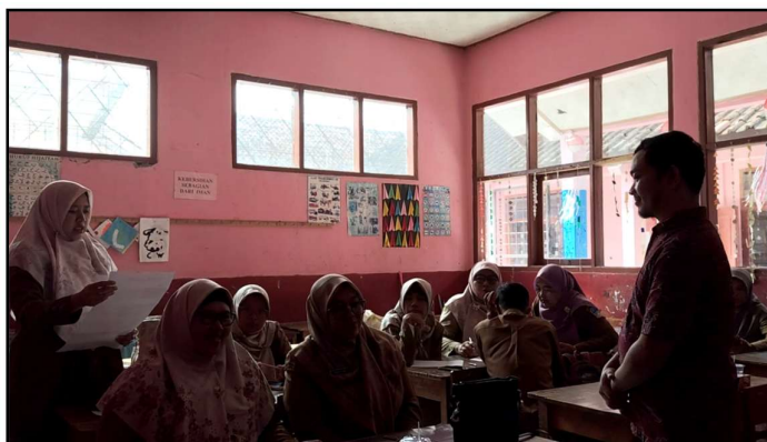
Gambar 4. Presentasi Kelompok Matahari

Memasuki sesi terakhir, peserta diajak menyanyikan kembali lagu perjuangan yang telah dibahas, yaitu Mars Pancasila dan Halo-Halo Bandung , untuk membangkitkan semangat dan menguatkan ekspresi serta penghayatan. Penulis mengamati bagaimana peserta menyampaikan makna lagu melalui sikap dan suara. Selanjutnya, peserta dibagi menjadi dua kelompok, yaitu kelompok Matahari dan kelompok Garuda. Masing-masing kelompok mendiskusikan makna lagu dan menyusun rencana sederhana penerapan nilai karakter dari lagu tersebut dalam pembelajaran siswa. Kegiatan ditutup dengan presentasi hasil diskusi secara singkat.