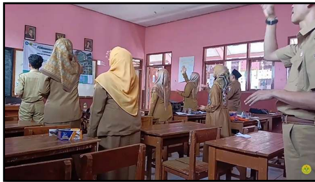
Gambar 5. Praktek Conducting oleh peserta

Lagu “Indonesia Raya” dipilih sebagai lagu latihan berjenis mars. Sementara lagu “Hymne Guru” untuk lagu berjenis hymne. Hal ini dilakukan untuk membedakan bentuk gerakan conducting antara lagu mars dan hymne dalam latihan. Lagu mars memiliki karakter cepat, ritmis, dan penuh semangat, sehingga gerakan tangan dalam conducting dilakukan dengan pola birama 2/4 atau 4/4 secara tegas dan mantap. Tangan kanan digerakkan secara energik untuk menjaga tempo, sementara tangan kiri digunakan untuk memberi penekanan dinamis. Sebaliknya, lagu hymne bersifat lambat, khidmat, dan ekspresif, biasanya menggunakan pola birama 3/4 atau 4/4 yang dilakukan dengan gerakan tangan yang lembut, mengalir, dan penuh penghayatan. Peserta diajak untuk memahami bahwa perbedaan karakter lagu harus tercermin dalam gerak tubuh dan ekspresi conductor.