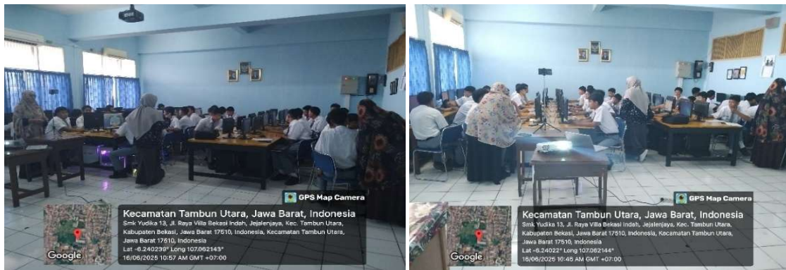
Gambar 3. Pendampingan Praktik Materi

Gambar 3 menunjukkan kegiatan setelah penjelasan materi selesai, yaitu mempraktekkan materi yang sudah disampaikan oleh narasumber. Siswa berlatih membuat animasi dan efek foto 3D pop-out dari file gambar, audio, dan foto yang sudah disiapkan oleh Tim Abdimas sebelumnya. Tim Abdimas bergerak berkeliling menghampiri siswa yang mengalami kesulitan dalam menjalankan instruksi/tahapan pembuatan animasi dan efek 3D pop-out agar siswa yang kesulitan tersebut mendapatkan solusi dengan baik dan tepat serta memahami solusi dari kesulitan yang dihadapi.