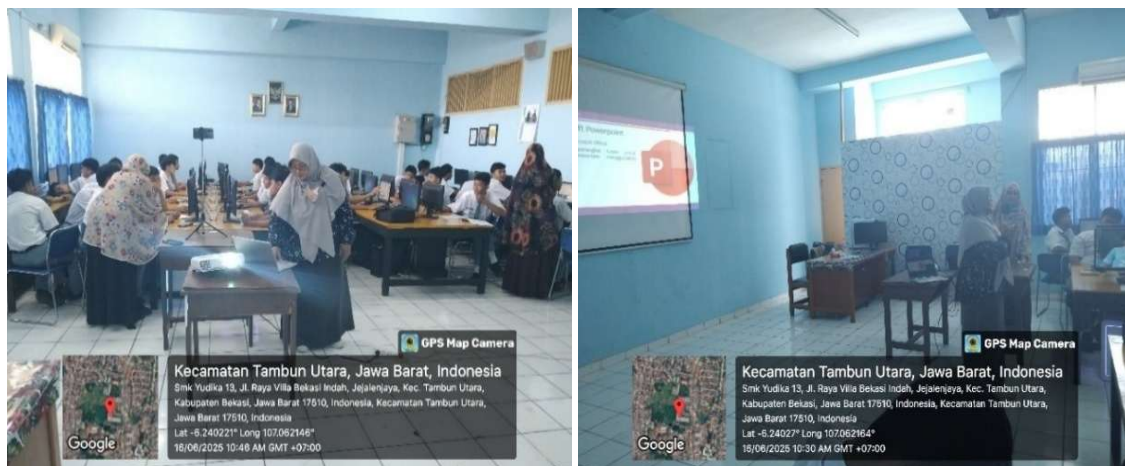
Gambar 2. Pemberian Materi oleh Narasumber

Pelatihan abdimas yang dilakukan oleh Tim Abdimas Gunadarma bekerjasama dengan SMK Yadika 13 Tambun Bekasi dengan judul "Pembuatan Animasi 3D Menggunakan Microsoft PowerPoint" sebagai bagian dari kegiatan siswa di luar jadwal sekolah. Kegiatan abdimas dilaksanakan dalam bentuk pemberian materi dan pendampingan pelaksanaan praktek pembuatan animasi 3D. Pemberian materi dilakukan narasumber melalui slide presentasi dan pendampingan praktik agar siswa dapat mengikuti instruksi yang diberikan dengan baik.