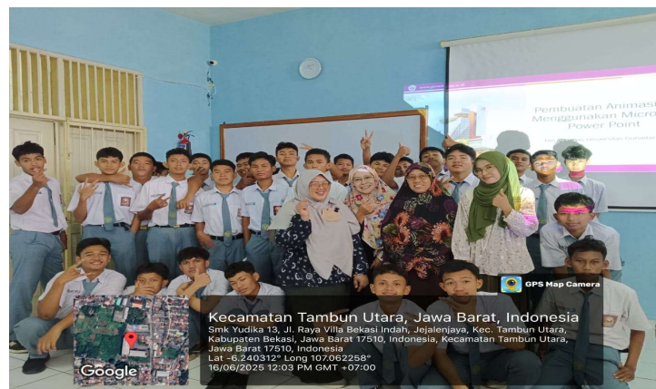
Gambar 4. Antusiasme Peserta Abdimas

Gambar 3 menunjukkan kegiatan setelah penjelasan materi selesai, yaitu mempraktekkan materi yang sudah disampaikan oleh narasumber. Siswa berlatih membuat animasi dan efek foto 3D pop-out dari file gambar, audio, dan foto yang sudah disiapkan oleh Tim Abdimas sebelumnya. Tim Abdimas bergerak berkeliling menghampiri siswa yang mengalami kesulitan dalam menjalankan instruksi/tahapan pembuatan animasi dan efek 3D pop-out agar siswa yang kesulitan tersebut mendapatkan solusi dengan baik dan tepat serta memahami solusi dari kesulitan yang dihadapi.