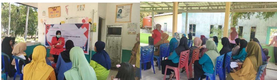
Gambar 2. Kegiatan Pengabdian

Adanya peningkatan motivasi dan partisipasi aktif peserta juga sejalan dengan riset (Hidayatullah & Sulastri, 2022), yang menegaskan bahwa pendekatan partisipatif mendorong keterlibatan emosional ibu dalam program kesehatan anak. Secara umum, kegiatan ini mendukung strategi nasional percepatan penurunan stunting sebagaimana ditinjau oleh (Kusnandar, 2023), yang menyatakan bahwa edukasi ASI dan pengasuhan anak merupakan faktor utama dalam pencegahan stunting berbasis komunitas.