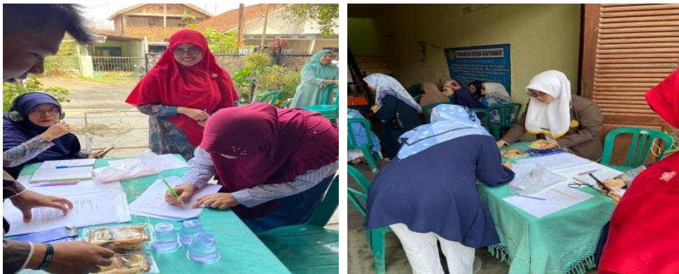
Gambar 2. Kegiatan presensi

Kegiatan ini memperkuat peran Posyandu sebagai pusat edukasi kesehatan komunitas, khususnya dalam isu kesehatan reproduksi yang masih minim disosialisasikan.