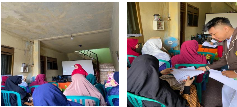
Gambar 3. Pembukaan dan Pre – tes