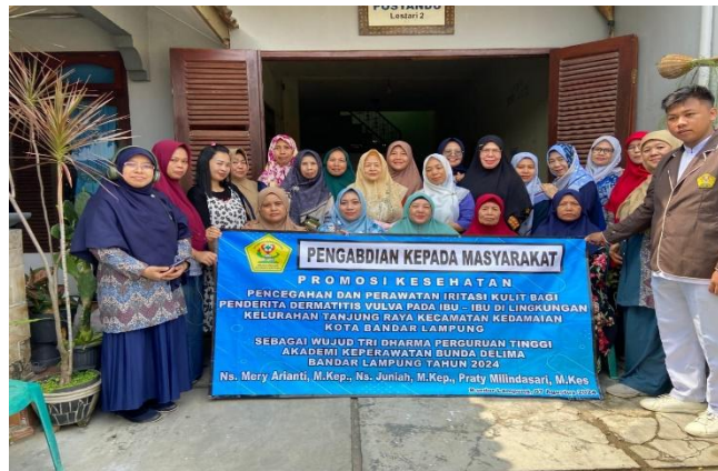
Gambar 4. Dokumentasi Foto bersama