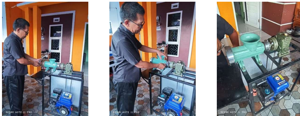
Gambar 7. Pemeriksaan Screw Penggiling

Pada Gambar 7, tim pengabdian melakukan pemeriksaan screw penggiling kacang tanah, diawali dengan melepas rumah screw untuk memeriksa kondisi fisik screw guna memastikan tidak terdapat keausan berlebihan, retakan, atau deformasi yang dapat mempengaruhi kualitas hasil gilingan. Pemeriksaan dilanjutkan dengan mengecek kebersihan screw dari sisa-sisa bahan yang menempel untuk mencegah kontaminasi dan penyumbatan saat operasi.