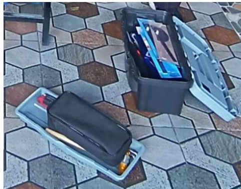
Gambar 4. Toolkit Perawatan