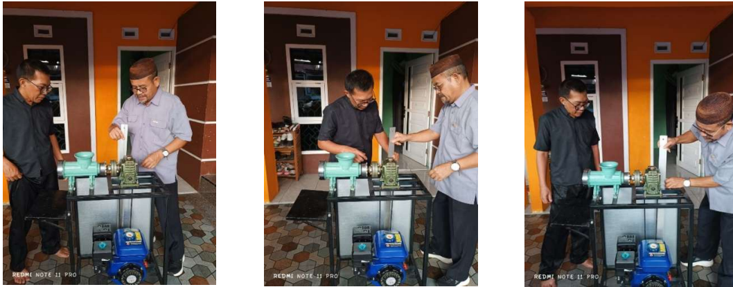
Gambar 6. Pemeriksaan Sabuk dan Puli

Pada Gambar 7, tim pengabdian melakukan pemeriksaan screw penggiling kacang tanah, diawali dengan melepas rumah screw untuk memeriksa kondisi fisik screw guna memastikan tidak terdapat keausan berlebihan, retakan, atau deformasi yang dapat mempengaruhi kualitas hasil gilingan. Pemeriksaan dilanjutkan dengan mengecek kebersihan screw dari sisa-sisa bahan yang menempel untuk mencegah kontaminasi dan penyumbatan saat operasi.