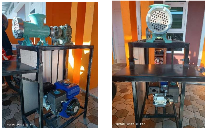
Gambar 1. Mesin Penggiling Kacang

Tahap persiapan diawali dengan kegiatan koordinasi bersama mitra UMKM Dimsum dan Siomay di Kecamatan Sungailiat untuk menyusun rencana pelaksanaan program pemeliharaan mesin. Kegiatan dilanjutkan dengan observasi lapangan terhadap kondisi awal mesin sebagaimana ditunjukkan pada Gambar 1.