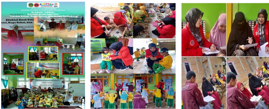
Gambar 2. Dokumentasi Kegiatan Pengabdian Kepada Masyarakat

Dari hasil observasi guru, perilaku anak selama dan setelah kegiatan menunjukkan perubahan ke arah yang lebih positif, seperti lebih komunikatif dalam menyampaikan perasaan dan lebih sadar terhadap pentingnya menjaga kebersihan. Guru juga merasa terbantu dengan adanya pendekatan pembelajaran yang variatif dan interaktif, sehingga suasana kelas menjadi lebih hidup dan menyenangkan.