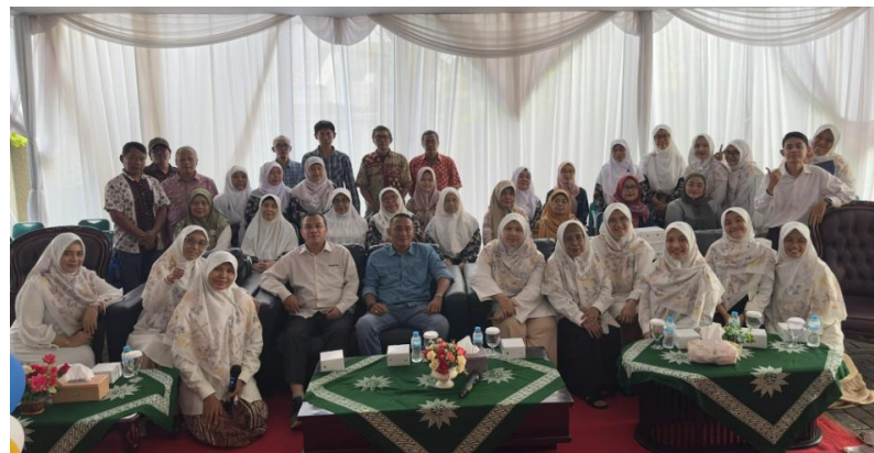
Gambar 2. Foto bersama tim pelaksana dan peserta

Kunci utama dalam menentukan atau identifikasi obat dan kosmetika halal adalah titik kritis, yaitu segala sesuatu yang berkaitan dengan proses produksi meliputi bahan baku, peralatan dan kondisi pembuatan produk halal (Wahyudi et.al, 2024). Terdapat banyak bahan-bahan dari sumber alami, hewani, dan sintetis yang menjadi critical point untuk menentukan apakah obat atau kosmetika tersebut halal atau haram, serta kemungkinan bahan-bahan yang dipastikan kehalalannya (Jaswir et.al, 2020). Masyarakat harus peduli dengan obat dan kosmetika yang digunakan, karena memang jumlah obat dan kosmetika halal di Indonesia belum sebanyak produk makanan. Hal ini diduga karena Industri obat atau kosmetika tidak atau belum merancang sebagai produk halal dari awal (Wahyudi et.al, 2024). Perlu ada dorongan masif oleh lembaga terkait untuk meningkatkan kepedulian pihak produsen agar mengembangkan produk obat serta kosmetika halal sebanyak mungkin.