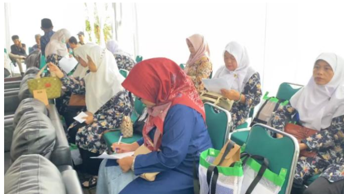
Gambar 1. Peserta melakukan pre-test

Edukasi produk kesehatan halal bagi masyarakat adalah sebagai upaya meningkatkan kesadaran akan hidup sehat dan Islami, serta juga sebagai fungsi perguruan tinggi khususnya lembaga pendidikan Muhammadiyah dalam mengamalkan dakwah amar ma'ruf nahi munkar. Manfaat edukasi biasanya akan terasa langsung oleh peserta karena adanya ketertarikan dengan tema halal, yang saat ini sudah menjadi gaya hidup masyarakat baik di desa ataupun kota (Nursal et.al, 2024). Keberhasilan edukasi dilihat melalui terjadinya perubahan pola pikir dan penilaian masyarakat sebelum dan setelah menerima materi.