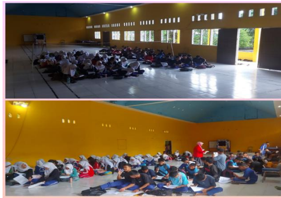
Gambar 2. Pengisian pre test dan post test