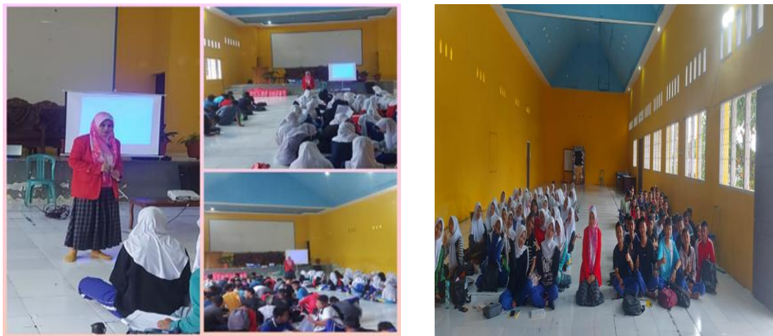
Gambar 3. Dokumentasi pengabdian masyarakat

Studi oleh Tika Nur Azizah et al. (2024) menunjukkan untuk menekan laju peningkatan permasalahan pernikahan dini saat ini, dibentuklah suatu program inovasi yaitu program The Action of GenRe yang memberikan pendidikan tentang pernikahan dini, sosialisasi tentang kesehatan reproduksi, dan program pendukung lainnya untuk meningkatkan kesadaran dan membantu para remaja dalam membuat keputusan yang tepat terkait kehidupan pernikahan. Program kegiatan pengabdian masyarakat ini memberikan peluang bagi para remaja untuk meningkatkan pemahaman tentang pentingnya pendidikan kesehatan sebelum menikah. Hal memperkuat validitas yang ada di SMAN 1 Banggai yang mana sekolah ini sudah terbentuk kelompok GenRe yang terdiri dari para remaja di sekolah tersebut. Sejalan dengan penelitian yang di lakukan oleh (Miatas Zulaizeh et al., n.d.) mengemukakan bahwa pendidikan kesehatan membantu orang mengambil sikap yang bijaksana terhadap kesehatan dan kualitas hidup. Hal ini memperkuat bahwa pendidikan kesehatan yang didapatkan sejak masa sekolah terutama dari lingkungan sekolah akan membantu siswa dalam penentuan kesehatannya kedepan.