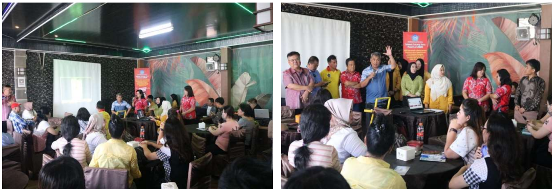
Gambar 2. Penyampaian Materi NIB dan Sertifikat Halal