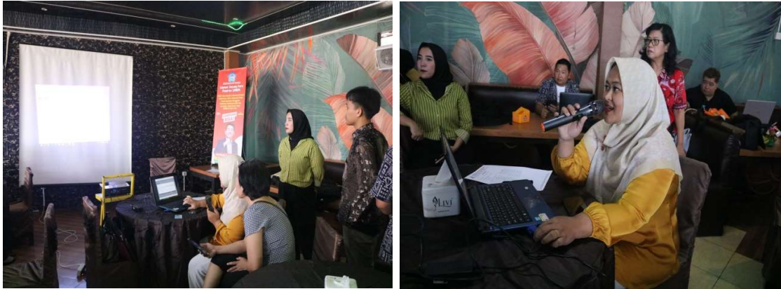
Gambar 3. Praktek Pembuatan NIB dan Sertifikat Halal