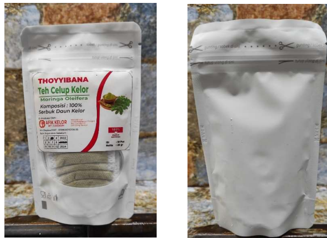
Gambar 1. Kemasan teh celup kelor

Kemasan teh celup kelor telah mencantumkan nama produk dan berat produk. Akan tetapi label pada kemasan teh celup kelor belum mencantumkan informasi nilai gizi sesuai dengan persyaratan label pangan pada kemasan. Berdasarkan kondisi analisis situasi maka permasalahan yang dihadapi oleh mitra KWT Srikandi yaitu label pada kemasan produk belum lengkap karena belum mencantumkan informasi nilai gizi dan kesehatan serta promosi dan pemasaran yang terbatas. Oleh karena itu pengabdian masyarakat yang akan dilakukan ini memiliki tujuan edukasi label kemasan terutama tentang informasi nilai gizi pada kemasan produk dan meningkatkan kemampuan digital marketing pada KWT Srikandi.