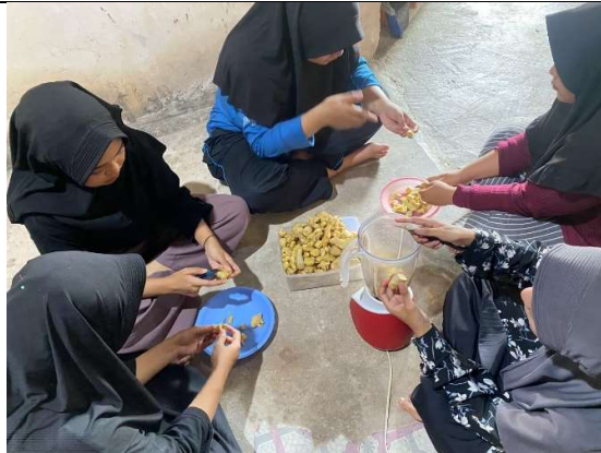
Gambar 3. Pembuatan Jamu Herbal Jahe

Pada saat pelaksanaan kegiatan, tim pengabdian berkumpul di satu tempat untuk melakukan kegiatan bersama dengan para ibu PKH. Tim pengabdian mengawali kegiatan dengan pemberian informasi terkait pengolahan jahe herbal ini, kemudian Tim Pengabdian dan para ibu PKH melakukan pembersihan jahe untuk di ambil airnya menjadi serbuk jamu herbal jahe (gambar 3). Proses pengolahan pertama diawali dengan pembersihan pada kulit jahe, kemudian jahe yang sudah bersih dicidungan air yang mengalir, setelah itu tim pengabdian bersama ibu PKH menggiling dan memeras jahe tersebut, sehingga hanya tersisa saripati jahe saja. Saripati jahe tersebut dimasak dengan api sedang serta ditambah dengan bahan-bahan lain seperti gula aren, bubuk kapulaga dan herbal lainnya. Proses memasak kemudian diteruskan hingga air menguap dan saripati jahe menjadi gumpalan kecil yang menyerupai serbuk kasar.