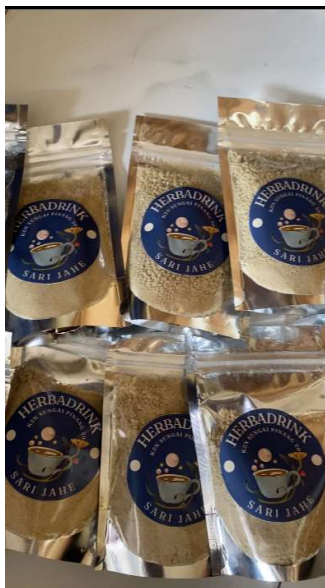
Gambar 4. Serbuk Jamu Herbal Jahe

Pada saat pelaksanaan kegiatan, tim pengabdian berkumpul di satu tempat untuk melakukan kegiatan bersama dengan para ibu PKH. Tim pengabdian mengawali kegiatan dengan pemberian informasi terkait pengolahan jahe herbal ini, kemudian Tim Pengabdian dan para ibu PKH melakukan pembersihan jahe untuk di ambil airnya menjadi serbuk jamu herbal jahe (gambar 3). Proses pengolahan pertama diawali dengan pembersihan pada kulit jahe, kemudian jahe yang sudah bersih dicidungan air yang mengalir, setelah itu tim pengabdian bersama ibu PKH menggiling dan memeras jahe tersebut, sehingga hanya tersisa saripati jahe saja. Saripati jahe tersebut dimasak dengan api sedang serta ditambah dengan bahan-bahan lain seperti gula aren, bubuk kapulaga dan herbal lainnya. Proses memasak kemudian diteruskan hingga air menguap dan saripati jahe menjadi gumpalan kecil yang menyerupai serbuk kasar.