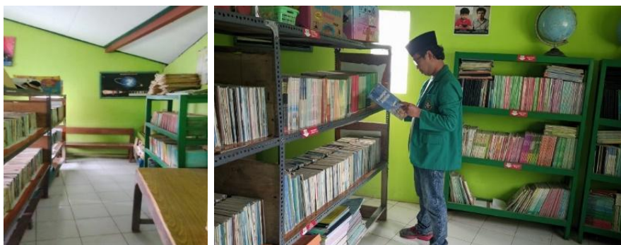
Gambar 6. Kondisi ruangan setelah direvitalisasi

Kemudian setelah dirapatkan Bersama, maka dibuatlah jadwal masuk ke perpustakaan bergantian untuk siswa dari masing-masing kelas.