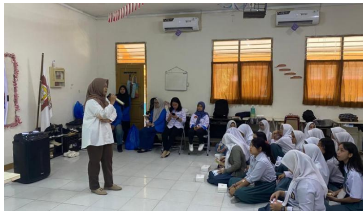
Gambar 1. Pemberian materi tentang kosmetik aman

Pemaparan materi ini menjadi dasar penting sebelum peserta diajak ke tahap simulasi. Dengan penjelasan yang sistematis dan menggunakan bahasa yang sederhana, peserta dapat memahami bahwa memilih kosmetik bukan hanya soal tren atau harga, melainkan berkaitan langsung dengan keselamatan dan kesehatan tubuh. Pemaparan materi ini bertujuan untuk meningkatkan pengetahuan peserta terkait kosmetik yang aman dan menghindari kosmetik ilegal. Hal ini sejalan dengan temuan Isnaeni (2023) yang menyebutkan bahwa faktor terjadinya peredaran produk kosmetik ilegal ialah kurangnya pengetahuan masyarakat terhadap kosmetik ilegal.