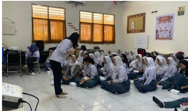
Gambar 3. Diskusi dan tanya jawab

membuat siswa lebih aktif dan termotivasi untuk bertanya serta berbagi pengalaman, sehingga informasi yang diberikan lebih mudah diterima dan diingat