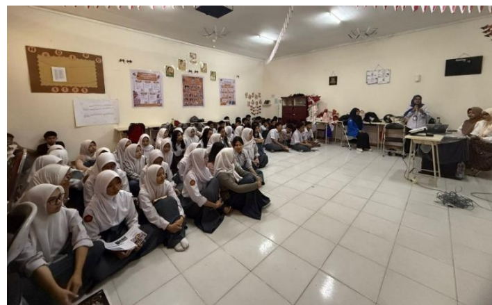
Gambar 2. Siswa SMA Lab School Palu peserta pengabdian