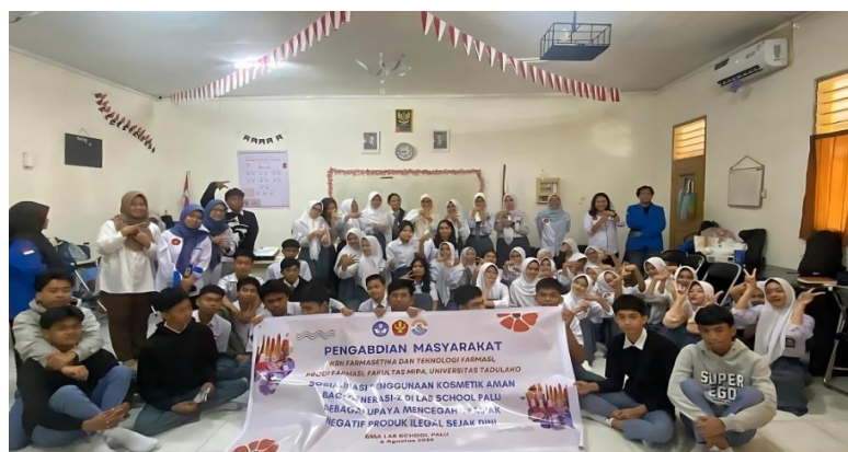
Gambar 6. Foto bersama tim pengabdian dengan peserta pengabdian

Secara keseluruhan kegiatan sosialisasi dinilai berhasil. Keberhasilan ini selain diukur dari ketiga komponen di atas, juga dapat dilihat dari antusiasme para peserta selama mengikuti kegiatan sosialisasi dari awal sampai selesai.