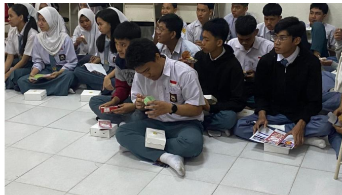
Gambar 4. Siswa membaca label dan mengecek Nomor izin edar BPOM

Tahap terakhir yaitu monitoring dan evaluasi yang dilakukan dengan memberikan pretest dan posttest kepada siswa. Hasil posttest akan dibandingkan dengan hasil pretest untuk dijadikan tolak ukur keberhasilan kegiatan pengabdian ini. Hasil kegiatan pengabdian secara garis besar sebagai berikut :