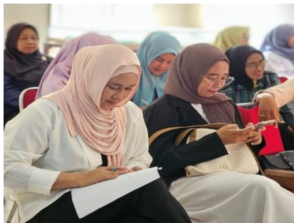
Gambar 2. Pengisian Pre-test

Temuan ini konsisten dengan penelitian Murray et al. (2023) yang menegaskan bahwa intervensi pola asuh positif mampu meningkatkan kapasitas orang tua dalam menerapkan pengasuhan berbasis kasih sayang, disiplin tanpa kekerasan, dan komunikasi efektif. Peningkatan rata-rata skor posttest juga sejalan dengan meta-analisis Piotrowska et al. (2023) yang menemukan bahwa program parenting berbasis komunitas memberikan dampak signifikan pada peningkatan kualitas pengasuhan.