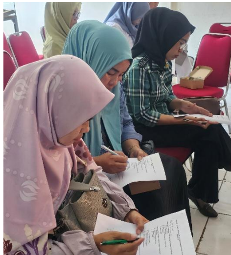
Gambar 4. Pengisian Pre-test

Jika dikaitkan dengan perkembangan intervensi parenting saat ini, hasil kegiatan ini mendukung pentingnya penguatan berbasis komunitas yang dipadukan dengan literasi digital. Studi Marsch et al. (2024) menunjukkan bahwa intervensi pengasuhan berbasis komunitas yang diperkuat dengan teknologi digital mampu meningkatkan skala dan keberlanjutan program. Dengan demikian, keberhasilan workshop tatap muka ini dapat ditindaklanjuti dengan strategi digital seperti modul daring, video singkat, atau kelompok belajar berbasis aplikasi perpesanan untuk memastikan pengetahuan tetap terinternalisasi.