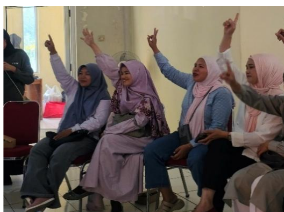
Gambar 3. Tanya Jawab Peserta

Peserta dengan skor awal rendah (50) mengalami peningkatan hingga 80, menunjukkan bahwa program ini berhasil menjangkau kelompok yang memiliki pemahaman awal terbatas. Peningkatan besar pada peserta dengan skor rendah memperlihatkan adanya efek pemerataan pengetahuan. Hal ini mendukung temuan Saleh et al. (2024) bahwa metode coaching dan simulasi yang diterapkan dalam konteks pelatihan pengasuhan mampu meningkatkan efikasi diri ibu, bahkan pada kelompok yang awalnya memiliki tingkat pengetahuan rendah.