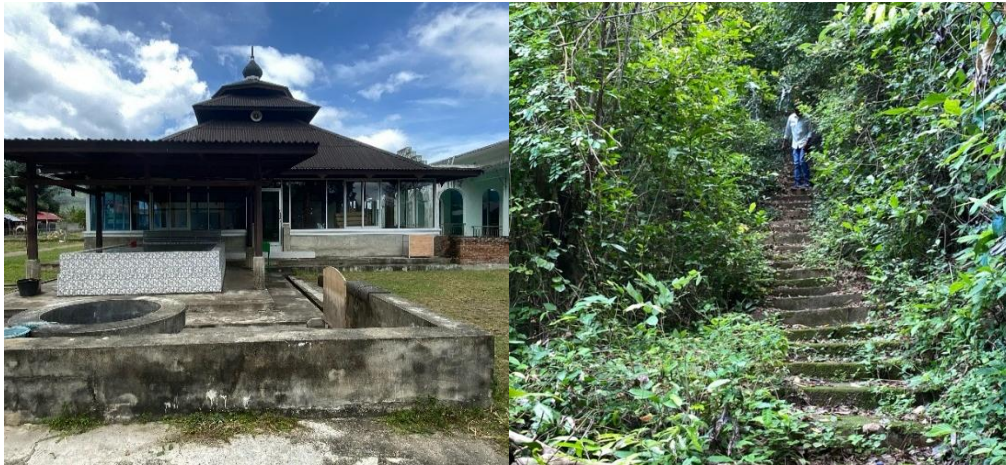
(a) Masjid Indra Purwa