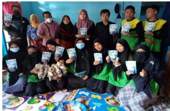
Gambar 3. Sosialisasi Digital Marketing dan Hasil Produksi Abon Lele