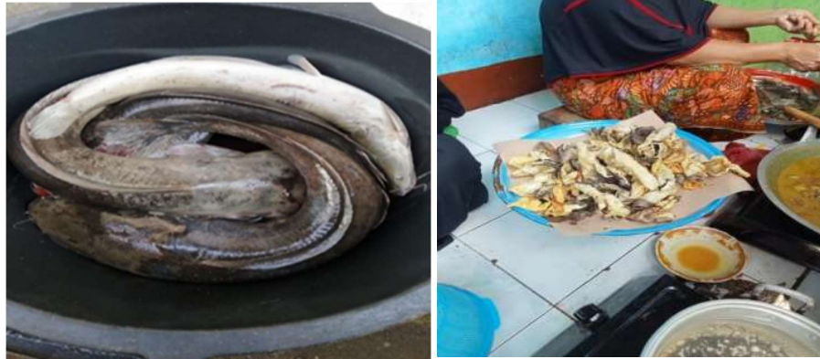
Gambar 2. Bahan Baku dan Proses Pembuatan Abon Lele

berjalan sesuai dengan yang diharapkan. Hal tersebut dibuktikan dengan beberapa dokumentasi yang diperoleh pada saat pelaksanaan berlangsung. Adapun beberapa dokumentasi yang dapat dilampirkan selama kegiatan berlangsung adalah sebagai berikut: