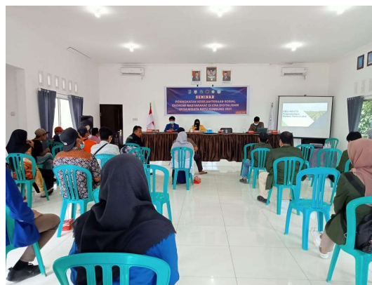
Gambar 4. Pelatihan penyampaian materi dan diskusi