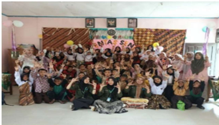
Gambar 4. Melaksanakan kegiatan pentas seni sekaligus perpisahan mahasiswa dengan sekolah