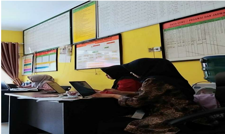
Gambar 3. Kegiatan Membantu Administrasi Sekolah dan Guru

Kegiatan membantu administrasi sekolah tidak banyak yang dapat dilakukan mahasiswa, dikarenakan Kepala Sekolah dan guru lebih menugaskan mahasiswa untuk membantu siswa/i dalam belajar. Tetapi dalam hal ini bukan berarti tidak ada yang dapat dilakukan. Mahasiswa juga mendapat kegiatan membuat surat sekolah yang didampingi oleh operator sekolah. Dengan begitu ada kegiatan yang dibantu, dan juga memberikan pengetahuan kepada mahasiswa mengenai pembuatan surat sekolah yang baik dan benar.