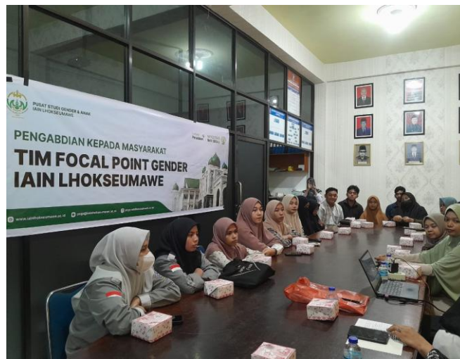
Gambar 3. Sesi diskusi interaktif antara peserta dan narasumber