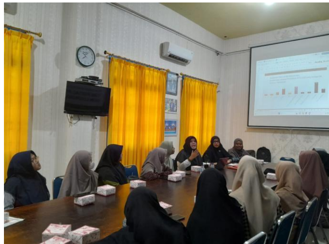
Gambar 2. Pemaparan materi oleh tim dosen pengabdian