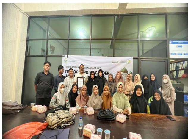
Gambar 4. Sesi foto Bersama dan penyerahan sertifikat