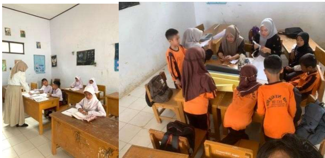
Gambar 2. Kegiatan mengajar dikelas

Dalam kegiatan mengajar mahasiswa Membantu guru walikelas melaksanakan pembelajaran di kelas apabila guru membutuhkan bantuan atau guru sedang tidak sempat mengajar atau masuk sekolah, Kegiatan peningkatan literasi dan numerasi siswa melalui pembelajaran di kelas dengan strategi dan media yang menarik serta mudah dipahami siswa, menerapkan Calistung (kelas membaca menulis dan berhitung) merupakan sebuah kelas tambahan untuk siswa kelas 1-6 yang memiliki kemampuan baca, tulis dan hitung yang masih rendah, Membaca 15 menit sebelum memulai pembelajaran. Serta Kegiatan setoran hapalan perkalian dan hapalan lainnya dan yang terakhir Kegiatan tanya jawab sebelum pulang sekolah.