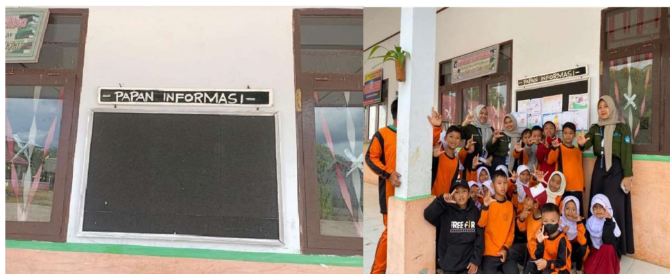
Gambar 5. Kegiatan Pembuatan Madding Sekolah